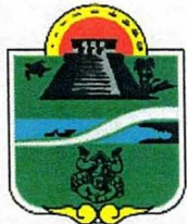
Municipio de Tulum