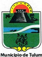
Municipio de Tulum