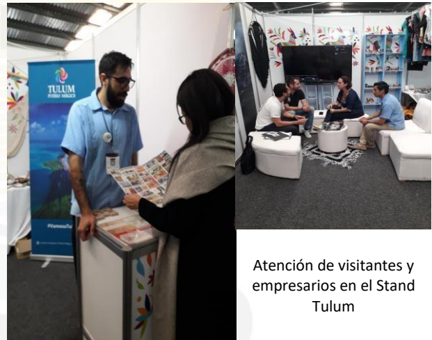
Atención de visitantes y empresarios en el Stand Tulum

El flujo de visitantes en el Stand fue constante, los datos que fueron proporcionados a cada uno de ellos fueron muy variados, pero podemos resaltar las siguientes: a cuántas horas se localiza Tulum del Aeropuerto de Cancún, porque Tulum fue nombrado Pueblo Mágico, qué distingue a Tulum del resto de destinos turísticos, etc.