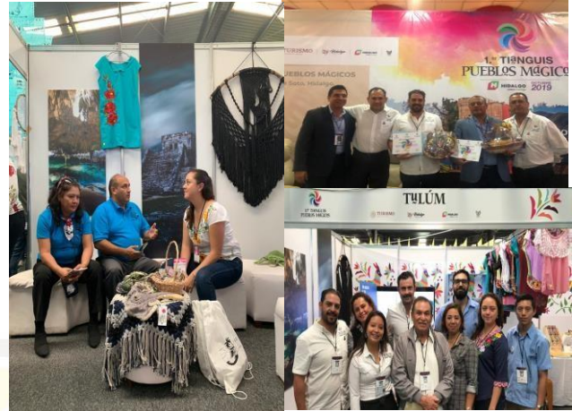
Actividades desarrolladas durante el primer Tianguis de Pueblos Mágicos 2019

En conclusión, ha sido una de las ediciones en las cuales los tres pueblos mágicos de Quintana Roo pudieron replantear la razón por la que son nombrados Pueblos Mágicos, partiendo de ello podemos complementar con los resultados y comentarios generales del Tianguis Pueblos Mágicos 2019: