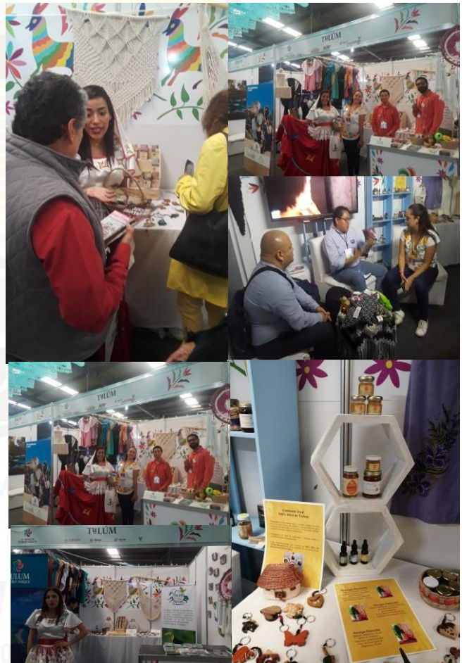
Exposición y venta de artesanías

Lo que nos da a entender que el 80% de las artesanías ofertada en este año fueron vendidas, que a comparación del año pasado hubo una venta del 30%, obteniendo una ventaja del 50% más de venta en esta edición.