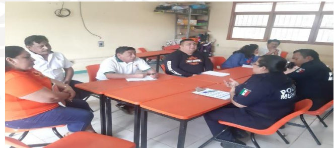
Telesecundaria Medina Loria