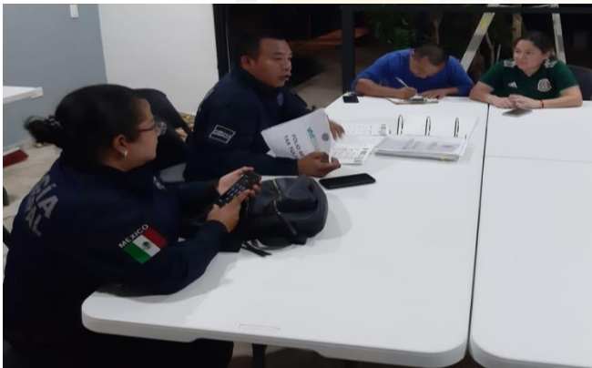
COL XUL KAA