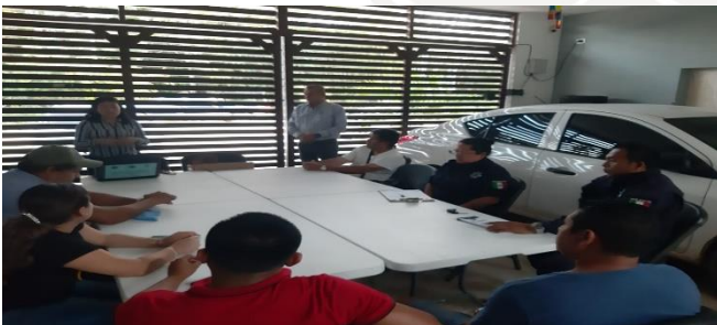
Vive Seguro Yax Tulum