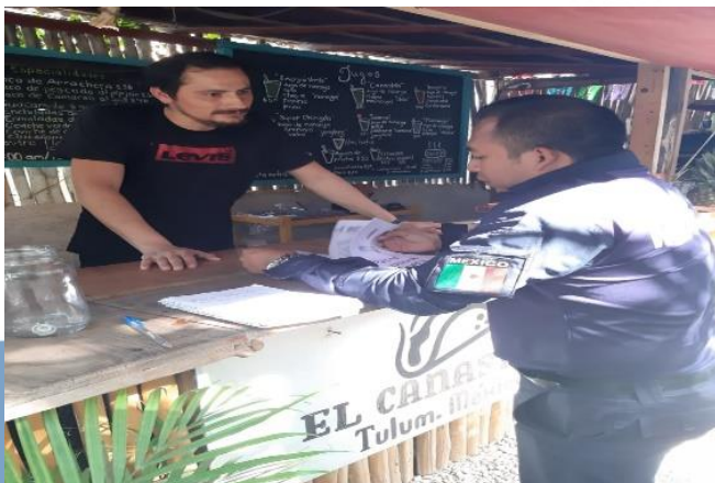
FRACCIONAMIENTO GUERRA DE CASTAS