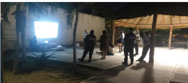
Vive Seguro Villas Tulum