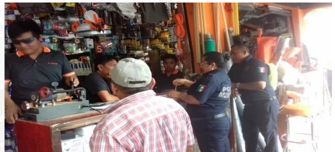
FERRETERIA EL TORNILLO