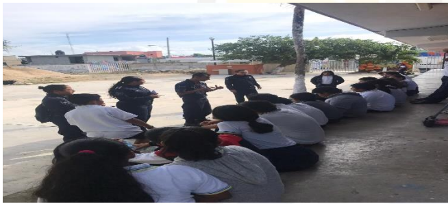
Telesecundaria José Vasconcelos