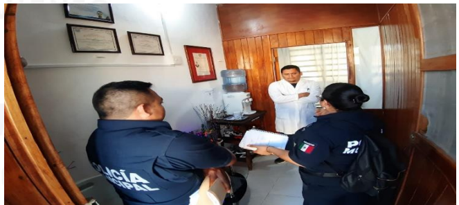
LABORATORIOS DEL CARIBE