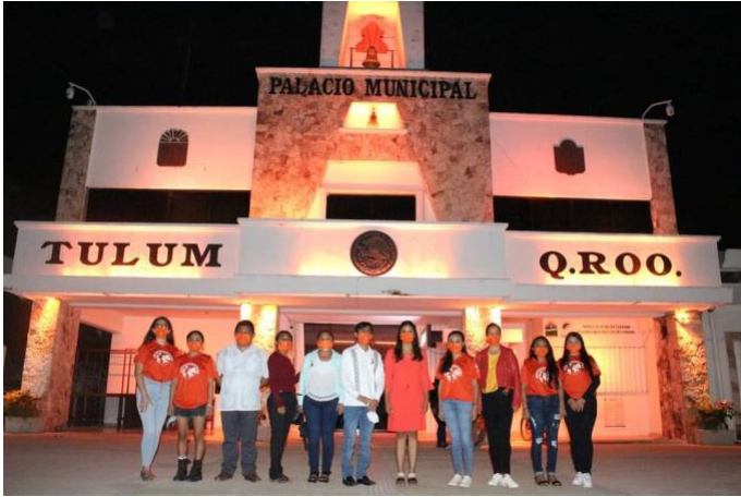
Encendido de Luces Naranja en solidaridad con el mes de prevención a la violencia contra la mujer.