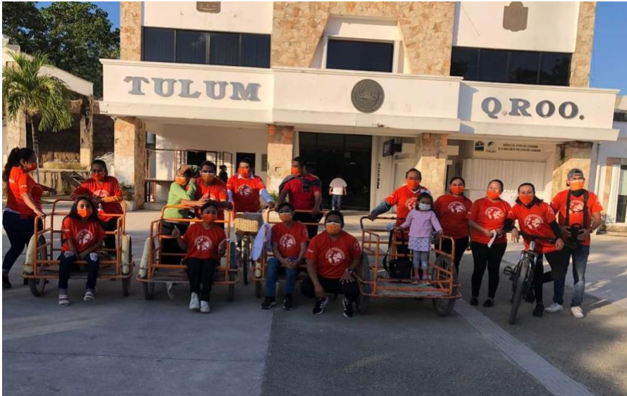
Rodada con Causa

El personal de la Dirección ha participado tanto en cursos como eventos impartidos por las entidades de la Administración para incrementar la armonía entre los ciudadanos del Municipio y la Administración Pública. A la vez promover el trabajo en equipo de las entidades de la Administración.