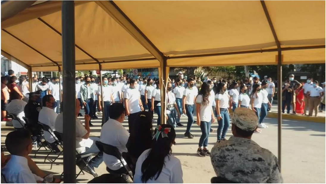
Desfile de la Revolución Mexicana