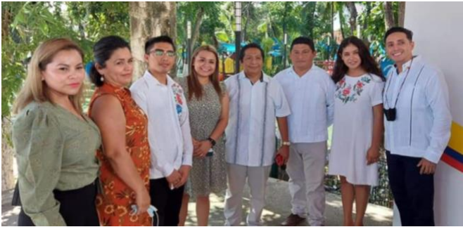
Baile Folclórico con invitados de Colombia