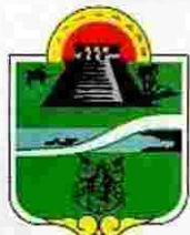
Municipio de Tulum