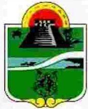
Municipio de Tulum