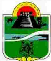
Municipio de Tulum