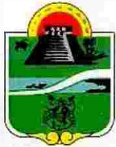
Municipio de Tulum