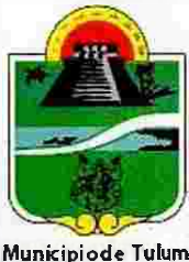
Municipio de Tulum