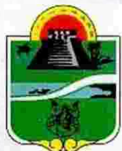
Municipio de Tulum