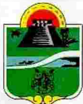
Municipio de Tulum