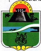
Municipio de Tulum