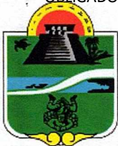
Municipio de Tulum