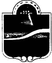
Municipio de Tulum