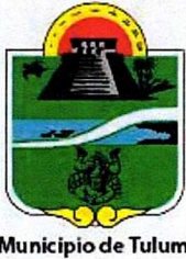
Municipio de Tulum