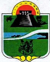
Municipio de Tulum