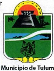
Municipio de Tulum