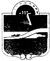
Municipio de Tulum