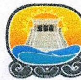
Municipio de Tulum

caso fortuito o fuerza mayor, tendrá la obligación de notificar de forma inmediata a la otra por escrito con acuse de recibo, motivando y fundamentando dicha circunstancia.