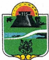
Municipio de Tulum