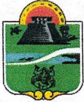
Municipio de Tulum