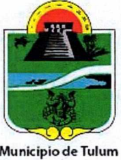
Municipio de Tulum