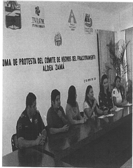
Fotografía 3 y 4. Toma de protesta fraccionamiento aldea Zama