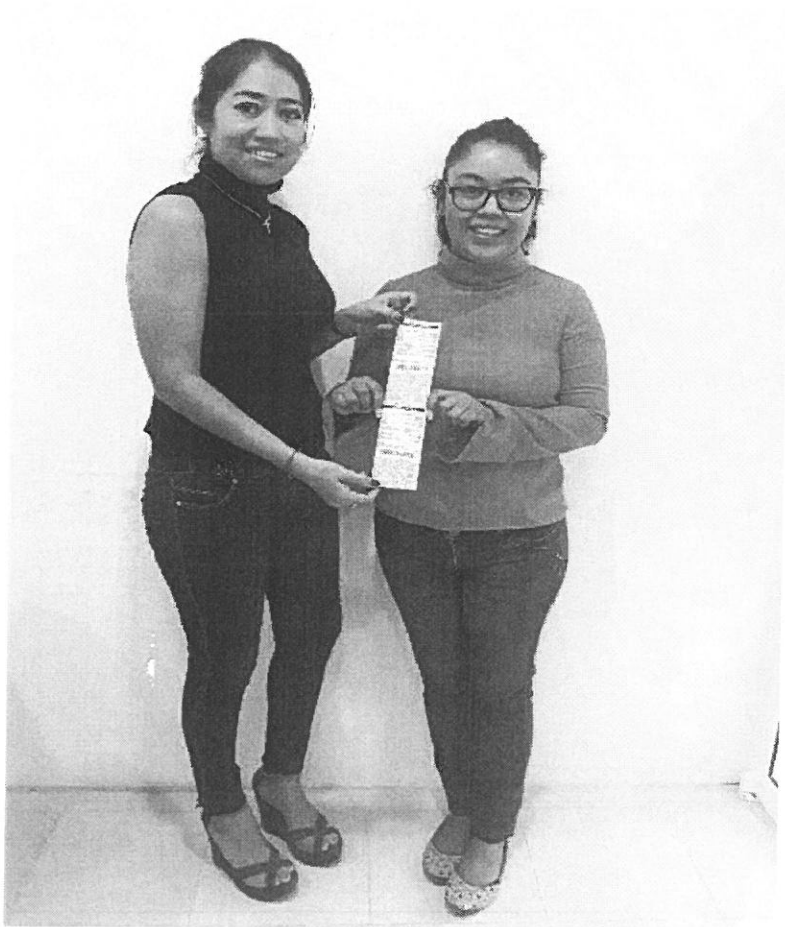
ANEXO FOTOGRAFIAS DIGITALES