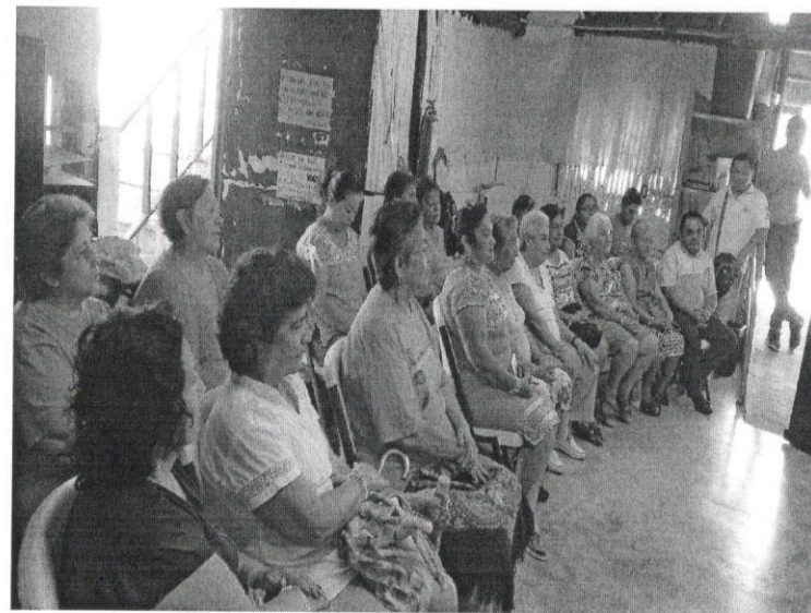
Evento: Taller "Empoderamiento y Motivación para Adultos Mayores" Lugar: palapa de los abuelitos. Fecha: 25 de abril de 2018.