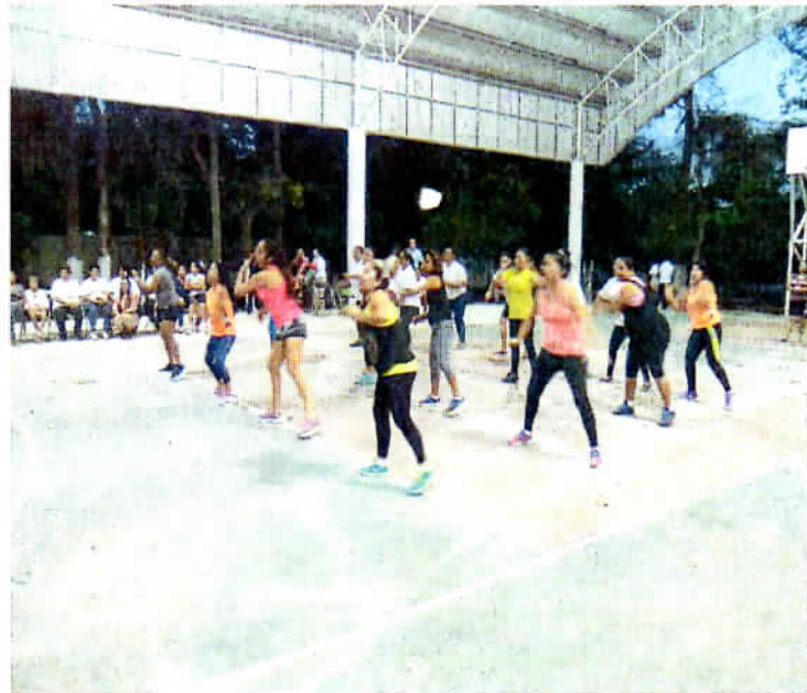
Evento: Día Naranja, Campaña Únete. Fecha: 25 de enero de 2017. Lugar: Domo de Chemuyil.