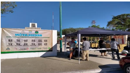
Figura 1. Punto: Explanada del Palacio Municipal.

A continuación, se presentan algunas fotografías del evento.