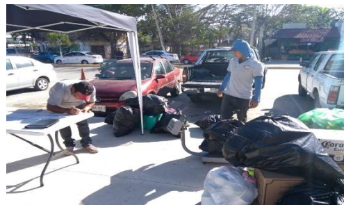
Figura 2. Punto: Explanada del Palacio Municipal.