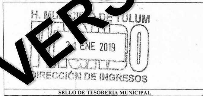
SELLO DE TESORERIA MUNICIPAL