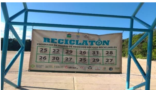
Figura 5. Punto: Akumal.