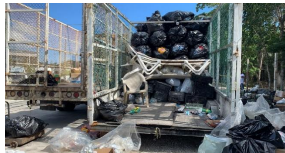
Figura 4. Punto: Chedraui.