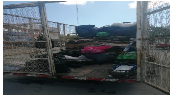
Figura 2. Punto: Explanada del Palacio Municipal.