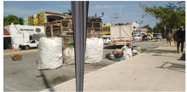
Figura 2. Punto: Explanada del Palacio Municipal.