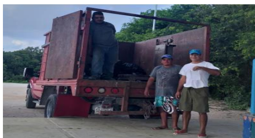
Figura 5. Punto: Akumal.