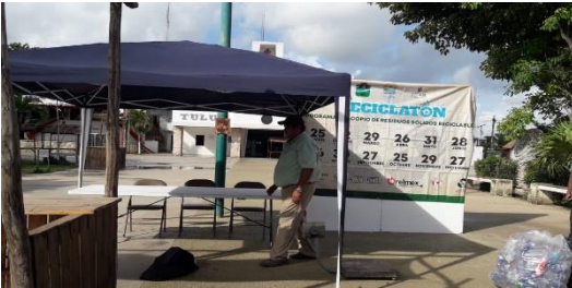
Figura 1. Punto: Explanada del Palacio Municipal.

A continuación se presentan algunas ilustraciones del evento.