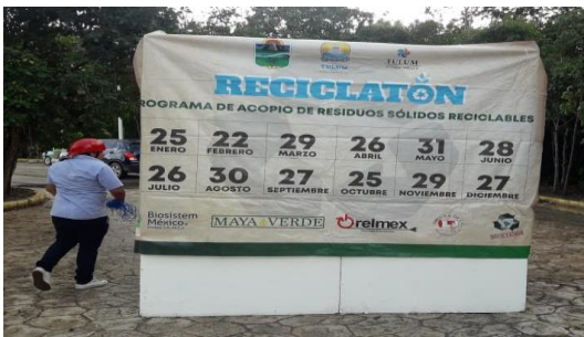
Figura 3. Punto: Chedraui.