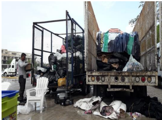
Figura 3. Punto: Chedraui.