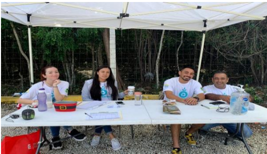
Figura 3. Punto: Chedraui.