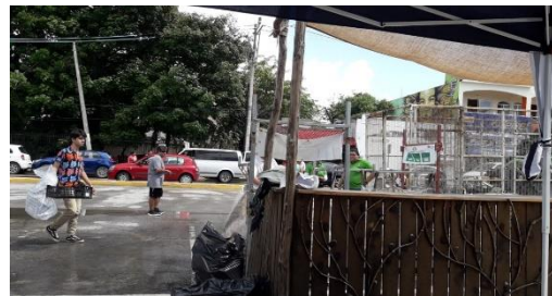
Figura 2. Punto: Explanada del Palacio Municipal.