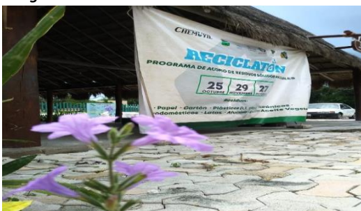
Figura 7. Punto Chemuyil