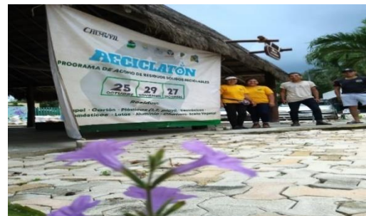
Figura 8. Punto Chemuyil