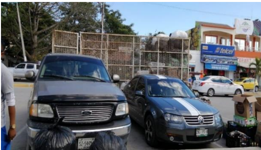
Figura 1. Punto: Explanada del Palacio Municipal.

A continuación, se presentan algunas ilustraciones del evento.