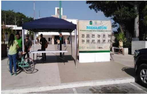
Figura 1. Punto: Explanada del Palacio Municipal.

A continuación, se presentan algunas ilustraciones del evento.