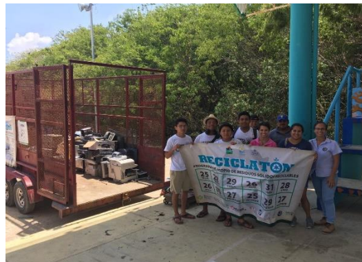
Figura 5. Punto: Akumal.