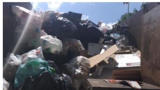
Figura 6. Punto: Akumal.