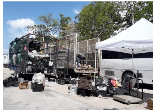
Figura 4. Punto: Chedraui.