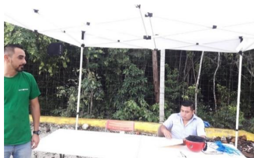
Figura 4. Punto: Chedraui.