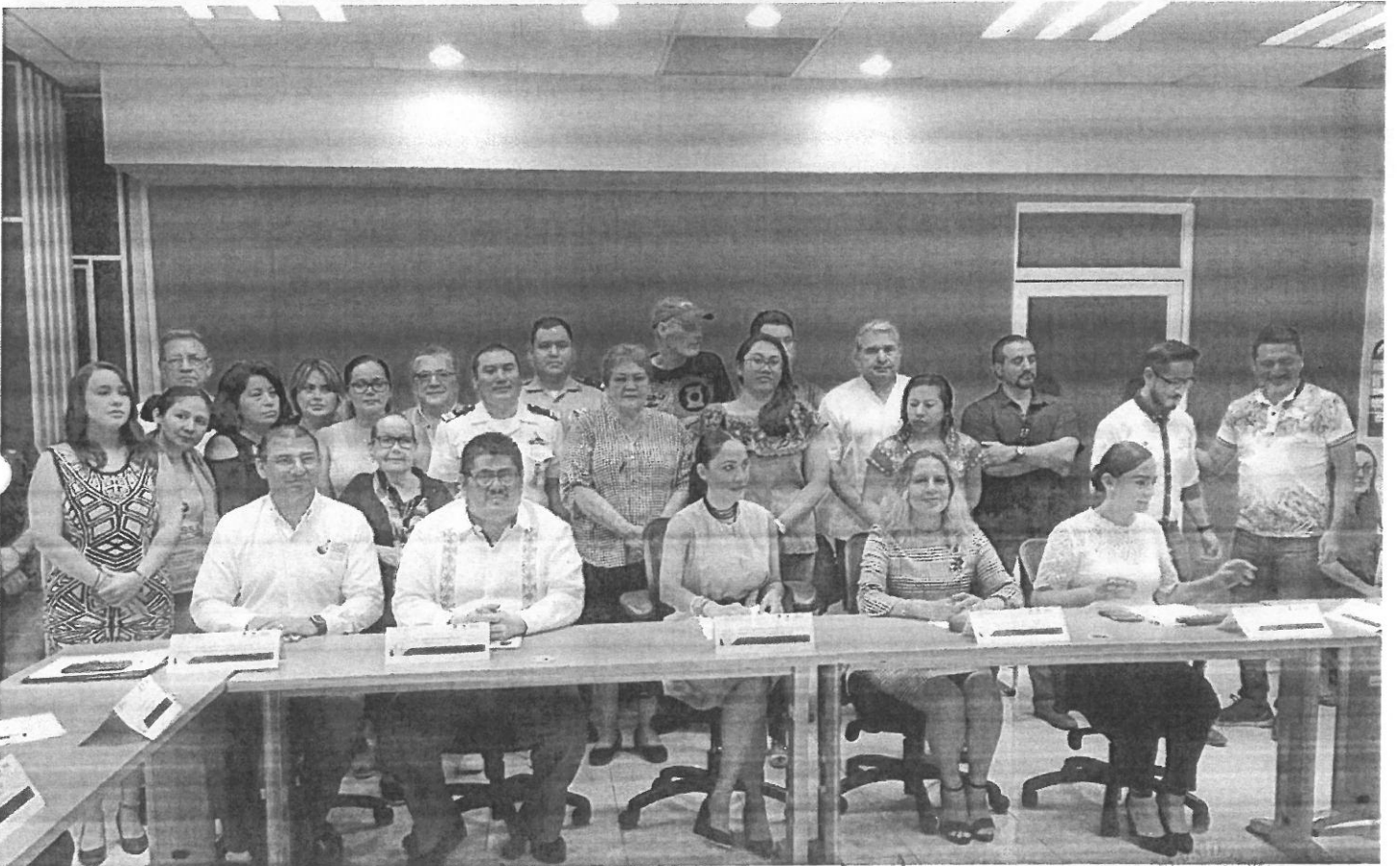
Reembolso de gastos por viaticos consejo estatal para a prevención y el control del síndrome de inmunodeficiencia adquirida (COESIDA), que se llevo a cabo el 16 de agosto del 2019, en la sala de juntas de los servicios estatales de salud en la ciudad de Chetumal Quintana Roo.