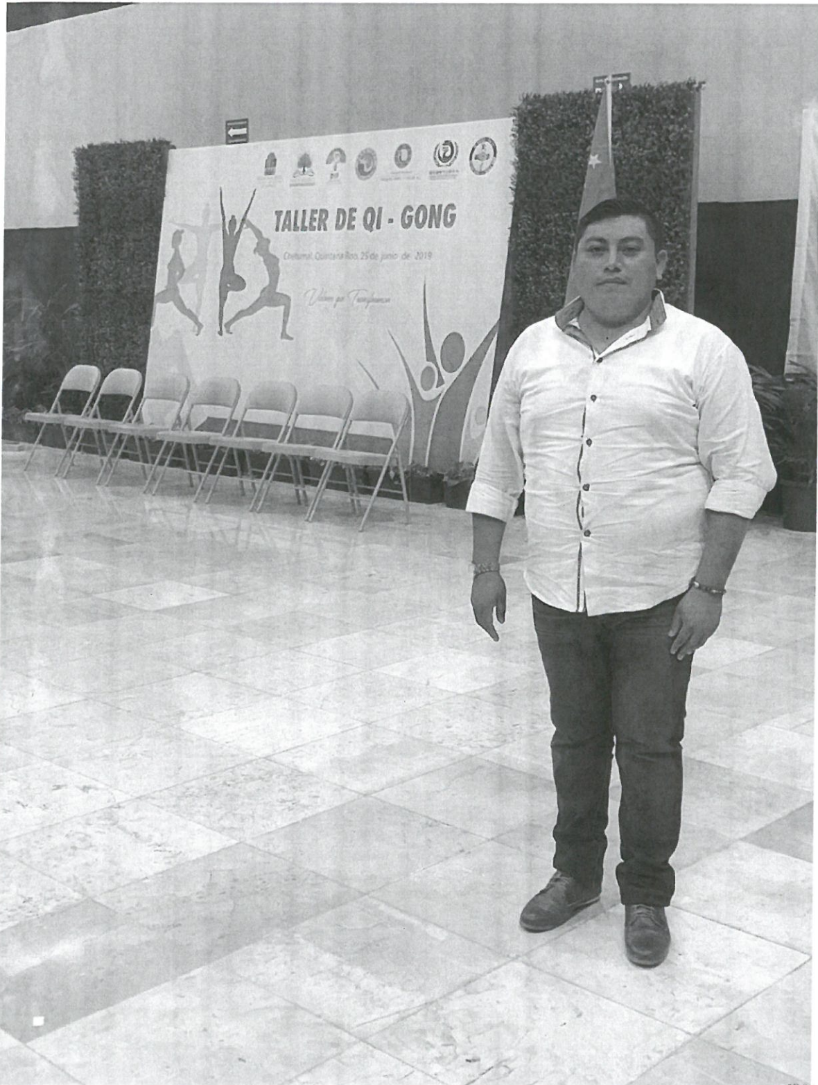
Asistencia de la clausura del curso capacitación y actualización de la práctica de Chi Kung en el centro de convenciones, en un horario de 12:00 hrs el cual se realizó el día viernes 28 de junio del 2019 en la ciudad de Chetumal, Quintana Roo.