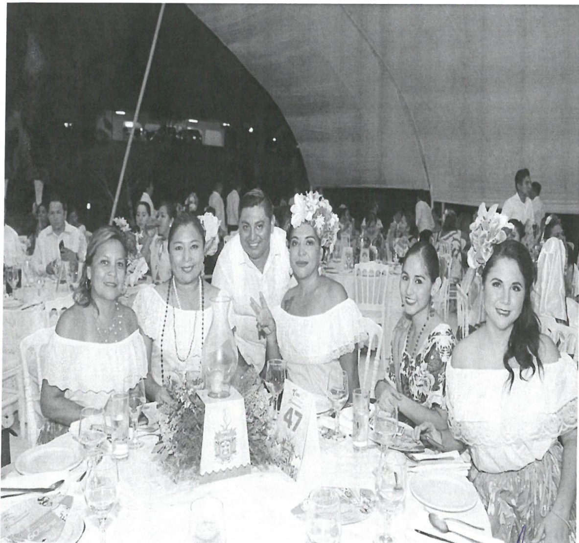
Asistencia de la cena del traje regional Quintanarroense, en la casa del Gobierno, en un horario de 19:00 hrs el cual se realizó el día viernes 28 de junio del 2019 en la ciudad de Chetumal, Quintana Roo.