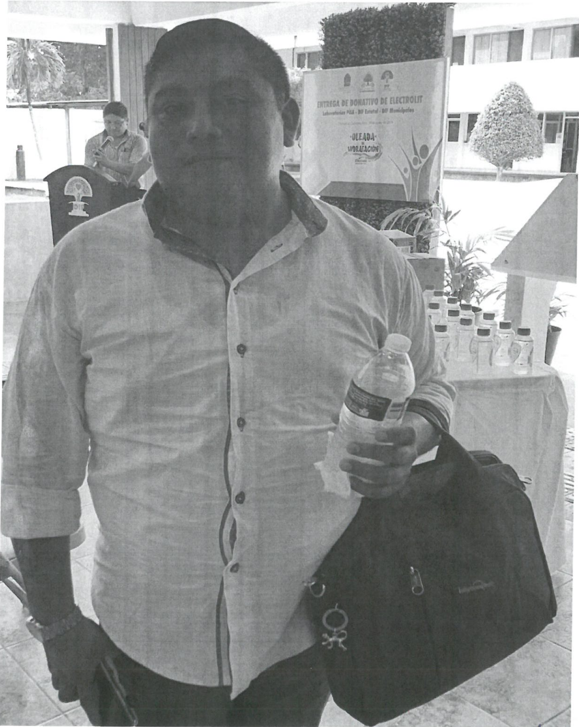
Asistencia de la entrega de Electrolitos por parte del Laboratorio PISA en la sala de juntas del DIF Estatal, ubicado en la avenida Adolfo López Mateos en un horario de 15:30 hrs el cual se realizó el día viernes 28 de junio del 2019 en la ciudad de Chetumal, Quintana Roo.