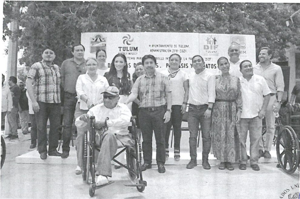
Gasto de representación que se generó de la entrega de sillas de ruedas, bastones y prótesis.