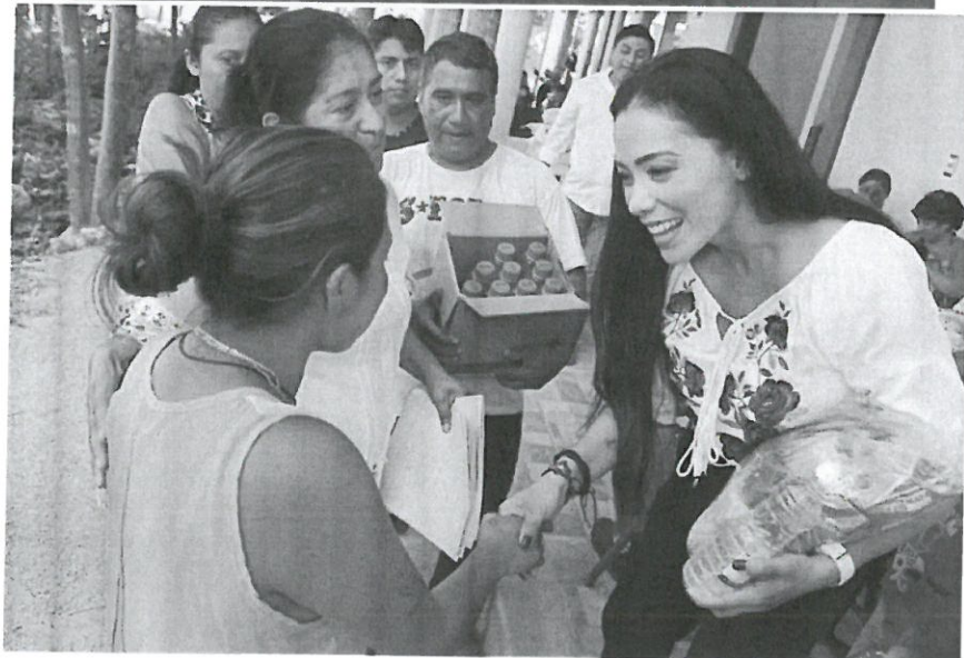
Gasto de representación que se generó en la entrega de sillas ruedas y despensas en la comunidad de Macario Gómez.