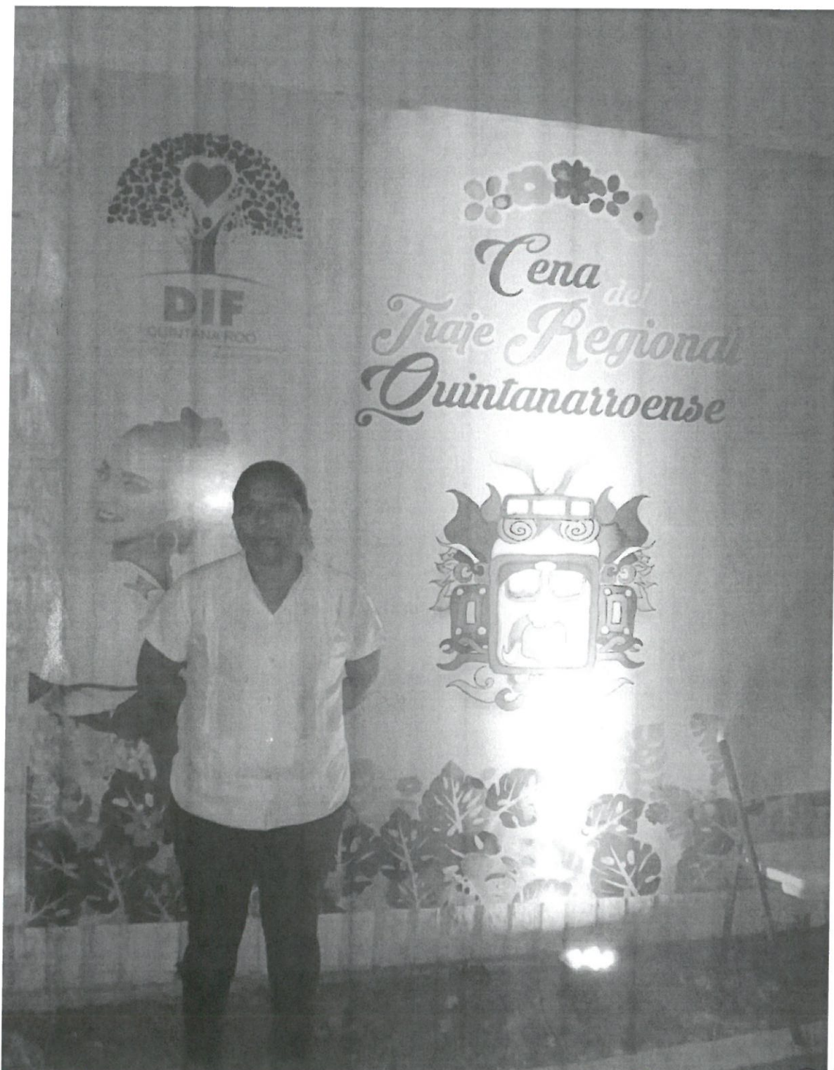
Asistencia de la cena del traje regional Quintanarroense, en la casa del Gobierno, en un horario de 19:00 hrs el cual se realizó el día viernes 28 de junio del 2019 en la ciudad de Chetumal, Quintana Roo.