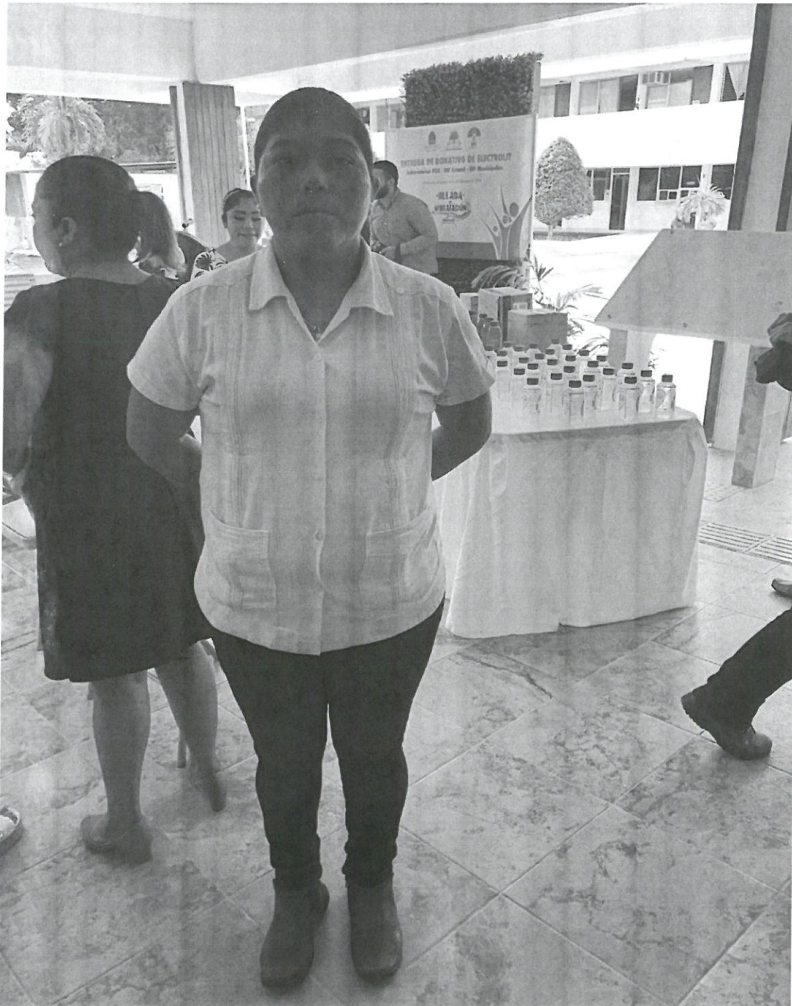
Asistencia de la entrega de Electrolitos por parte del Laboratorio PISA en la sala de juntas del DIF Estatal, ubicado en la avenida Adolfo López Mateos en un horario de 15:30 hrs, el cual se realizó el día viernes 28 de junio del 2019 en la ciudad de Chetumal, Quintana Roo.