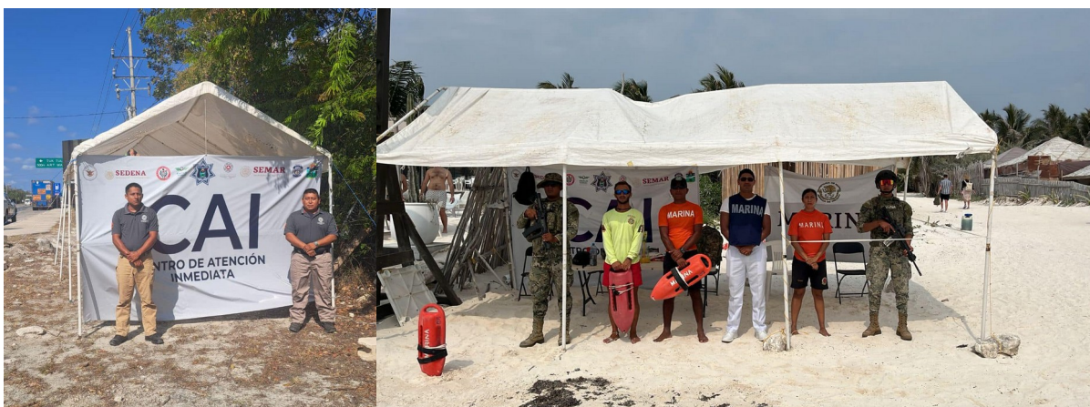
Figura 1.1. Centros de Atención al local y turista durante las actividades de Semana Santa en Tulum, 2024 y 2025.

Se desplegó el operativo "Semana Santa Segura" con 450 elementos de los tres niveles de gobierno para proteger tanto a residentes como a turistas en zonas de playa y el Parque Nacional del Jaguar.