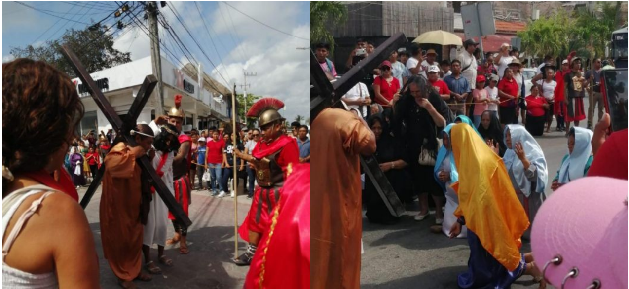
Figura 5.2. Marcha del Silencio durante la Semana Santa en Tulum 2023.

Son recorridos que hacen los fieles o creyentes para llegar al santuario de su devoción y, comúnmente, se realizan en lugares pocos propicios, como vías rápidas o carreteras sin ningún tipo de acotamiento apto para peatones. De este modo, los peregrinos están expuestos a todo tipo de peligros. Las peregrinaciones son comunes en las festividades religiosas, a menudo recorriendo largas distancias. Estas peregrinaciones pueden involucrar a miles de personas y requieren coordinación y logística específica.