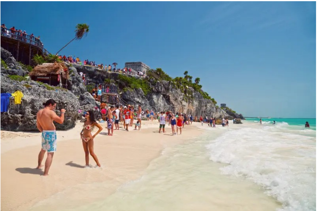
Figura 5.1. Playas colindantes con la zona arqueológica de Tulum cabecera municipal durante Semana Santa 2025.

Las playas del municipio de Tulum suelen tener mayor afluencia de personas durante los últimos días de Semana Santa, especialmente de turistas nacionales debido a los días libres que habitualmente dan a los trabajadores, también debido a que niños y adolescentes tienen entre una y dos semanas de vacaciones.