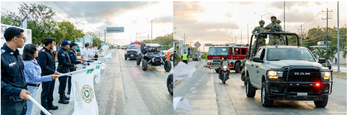
Figura 5.%. Banderazo de inicio de operaciones alusivas a Semana Santa segura.

Anualmente se instala el “banderazo” referente al periodo de mayor influencia de población al municipio a causa de las fiestas de Semana Santa. Quintana Roo es de los sitios turísticos