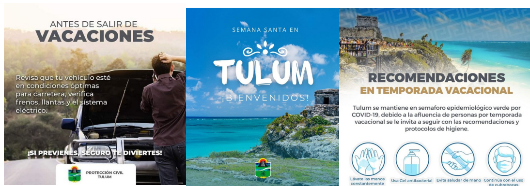
Figura 5.3. Propaganda de divulgación de la temporada vacacional de Semana Santa

De acuerdo a lo anterior, la Dirección General de Protección Civil y Bomberos de nuestro municipio realiza advertencias oportunas acerca de la temporada de vacaciones alusiva a Semana Santa, con el fin de mantener a la población informada por medio de comunicación oficiales.