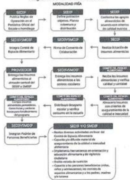
Programa de Alimentación Escolar