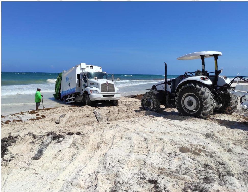
Ilustración 7 VEHICULO DE RECOLECCION DE SARGAZO DEL GOBERNO ESTATAL SE ATASCA EN LA PLAYA