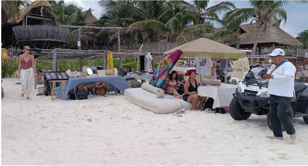
Ilustración 4 COMERCIO AMBULANTE SIN AUTORIZACION EN ZONA FEDERAL