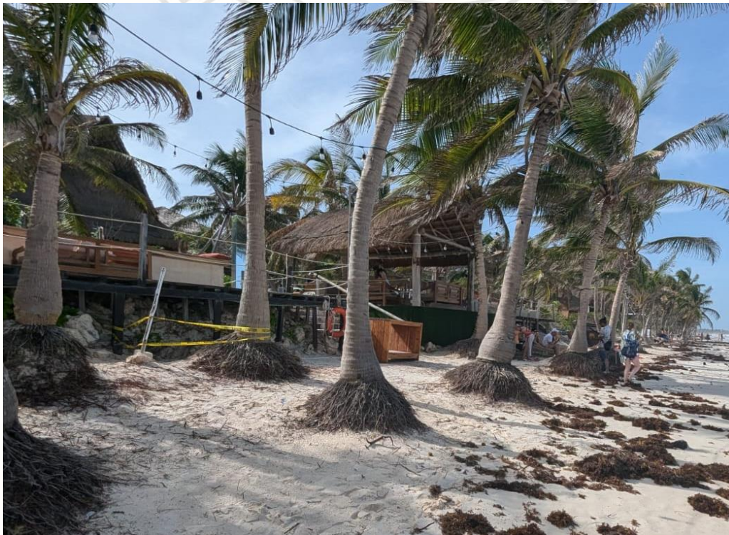
Ilustración 2 SE RECIBE DE REPORTE DE LA ZONA FEDERAL ACORDONADA