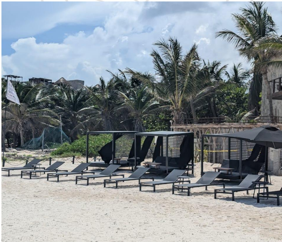
Ilustración 1 OBRA CIVIL EN ZONA FEDERAL, SE PROCEDE A SOLICITAR DOCUMENTACION FEDERAL

A continuación, se adjuntas las fotografías de las actividades del equipo de vigilancia.