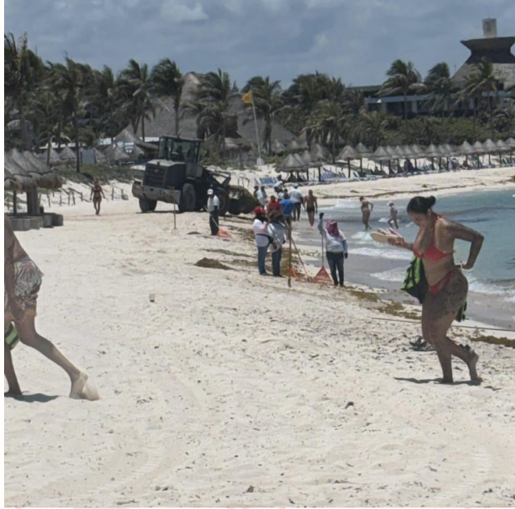
Ilustración 5 TRACTO CAMION EN BAHIA PRINCIPE PARA RECOJA DE SARGAZO