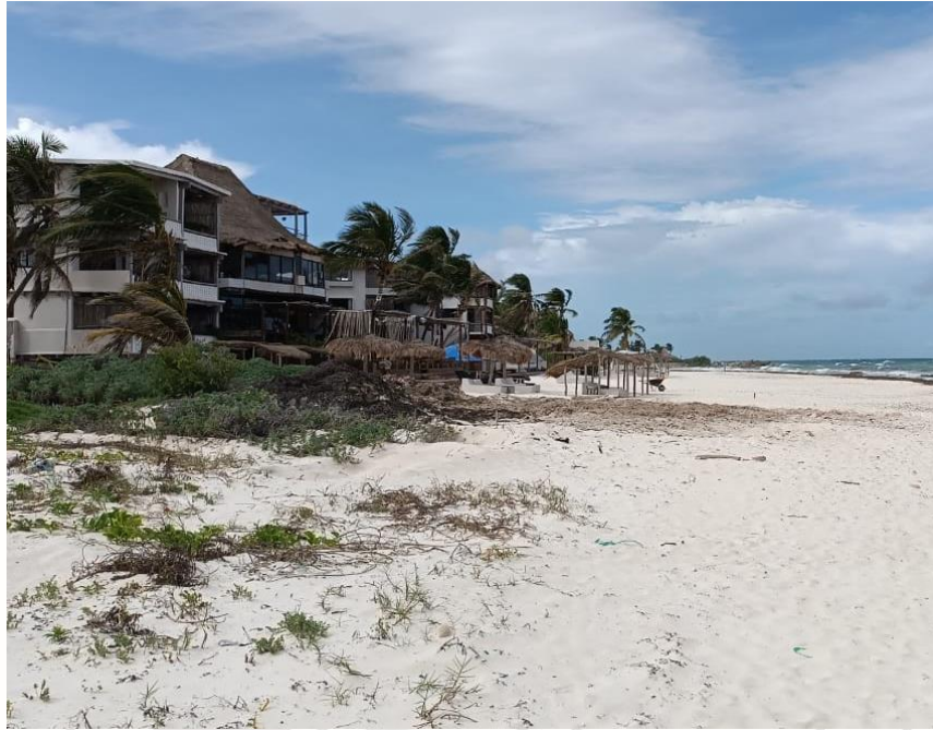
Ilustración 8 MOVIMIENTO DE ARENA EN LA ZONA FEDERAL ES REPORTADO, SE PROCEDE A REVISAR Y ACTUAR CON CITATORIO