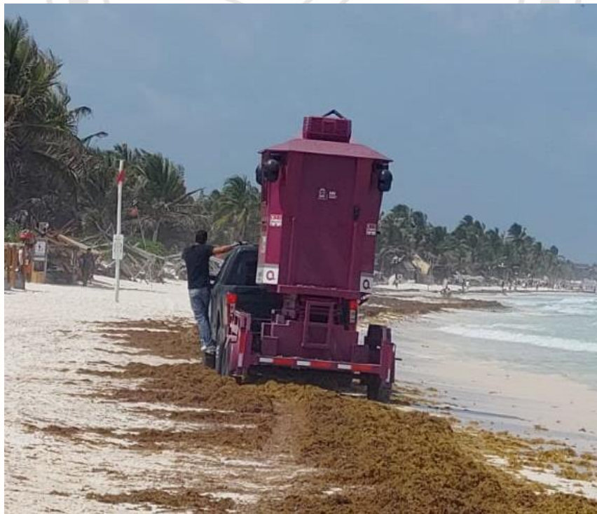
Ilustración 3 REMOLQUE CON CASETA DE LA POLICIA ESTATAL