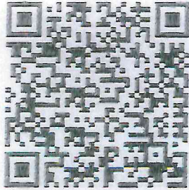
Normatividad Firma electrónica ASF

En este sentido, es de destacar que, el ingreso a la plataforma SiCAF será por medio de la Firma Electrónica Avanzada de la Auditoría Superior de la Federación, de la cual de conformidad con lo dispuesto en los artículos 1, fracción I y 2, fracción I del ACUERDO PARA LA IMPLEMENTACIÓN DE LA FIRMA ELECTRÓNICA AVANZADA DE LA AUDITORÍA SUPERIOR DE LA FEDERACIÓN, así como, el numeral 1.4. de las POLÍTICAS PARA LA OBTENCIÓN DE CERTIFICADOS DIGITALES, podrá obtener más información para tramitarla al ingresar a los siguientes QR.