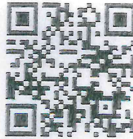
Portal Firma Electrónica ASF

No obstante, se hace de su conocimiento que también podrá ingresar a la plataforma del SiCAF con la e.firma que emite el Servicio de Administración Tributaria.