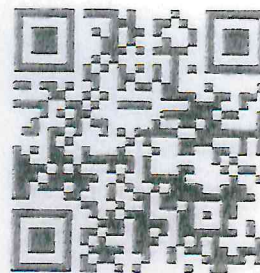
Portal Firma Electrónica ASF

No obstante, se hace de su conocimiento que también podrá ingresar a la plataforma del SiCAF con la e.firma que emite el Servicio de Administración Tributaria.