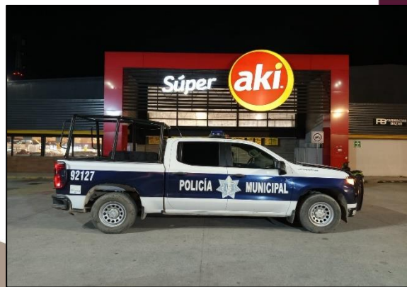
Km. 1.5, carretera Tulum-Boca Paila, Tulum, Q. Roo. C.P. 77780.