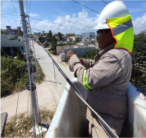
REHABILITACIÓN DE LÍNEAS DE ALUMBRADO PÚBLICO; POBLADO DE AKUMAL, COL. TORTUGA.