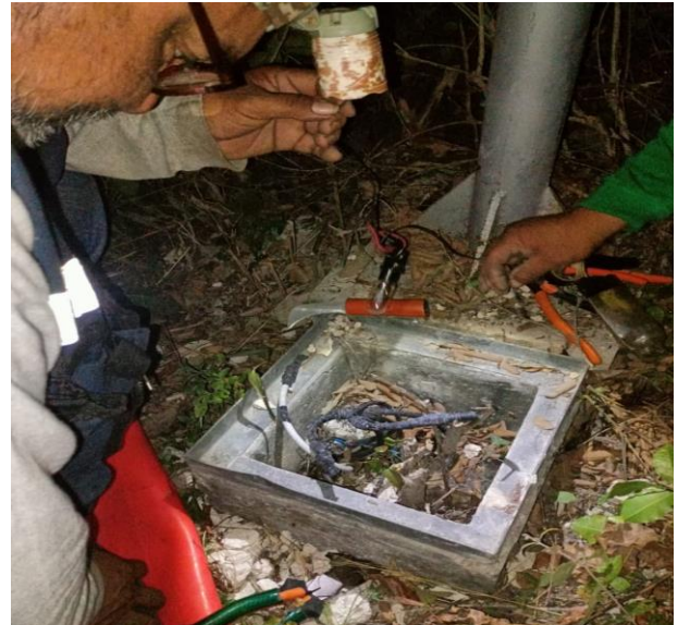
REHABILITACIÓN DE LÍNEAS DE ALUMBRADO PÚBLICO; COL. TUMBEN KAA, AV. 1 Y AV. 18.