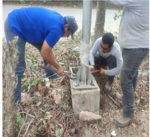
CAMBIO DE POSTE DAÑADO POR NUEVO; COL. TUMBEN KAA, CALLE RIO ZANAPA Y AV. 1.