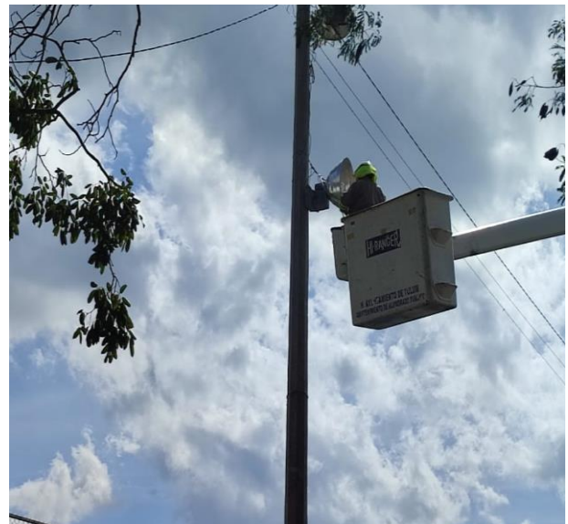
REHABILITACIÓN DE 6 REFLECTORES; POBLADO DE COBA, EN LA UNIDAD DEPORTIVA.