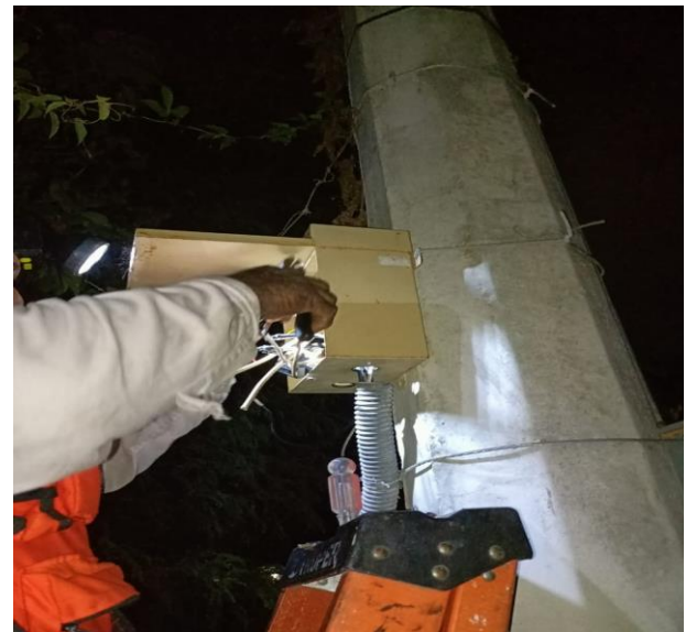
REHABILITACIÓN EN BANCO DE CONTROL; COL. LA VELETA, AV. 12 ENTRE CALLE 13 Y 15.