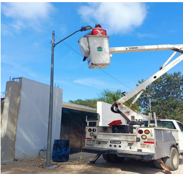
REHABILITACIÓN DE LUMINARIA; COL. LA VELETA, CALLE PUNTA ALLEN ENTRE CALLE ZAC-BE Y AV. BOCA PAILA.