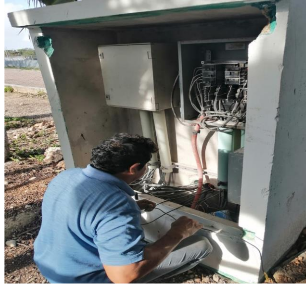
REHABILITACIÓN EN BANCO DE CONTROL; COL. MAYAPAX, CALLE JUPITER ENTRE CALLE TUN-K'UL Y 4 OTE.