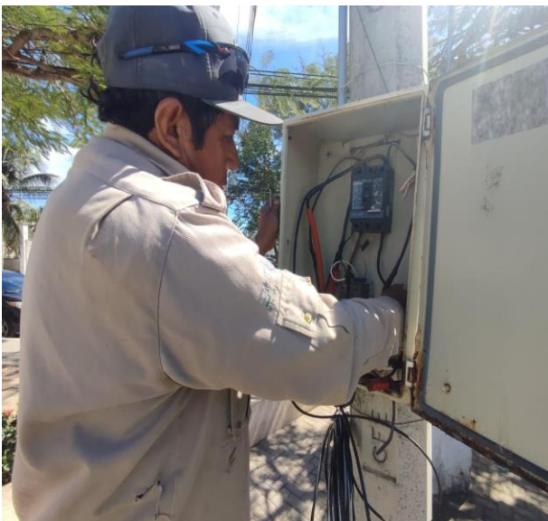
REHABILITACIÓN EN BANCO DE CONTROL; COL. CENTRO, EN EL PARQUE DOS AGUAS.