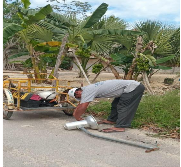
REHABILITACIÓN DE LUMINARIA; POBLADO DE MANUEL ANTONIO AY.