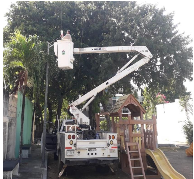
CAMBIO DE 2 POSTES DAÑADOS POR NUEVOS; FRACCIONAMIENTO VILLAS TULUM, EN EL PARQUE.