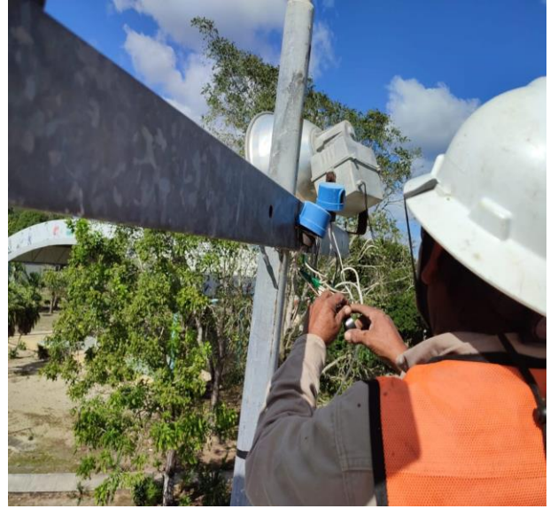
REHABILITACIÓN DE 7 REFLECTORES; POBLADO DE SAN JUAN.