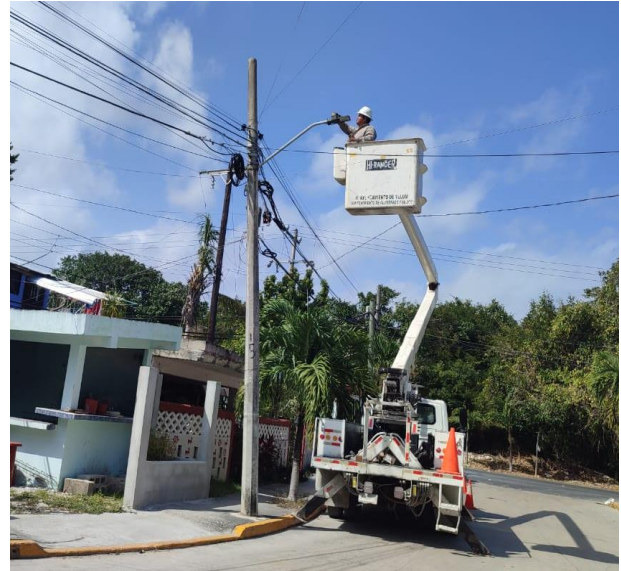
REHABILITACIÓN DE FOTOCELDA; POBLADO DE CHEMUYIL.