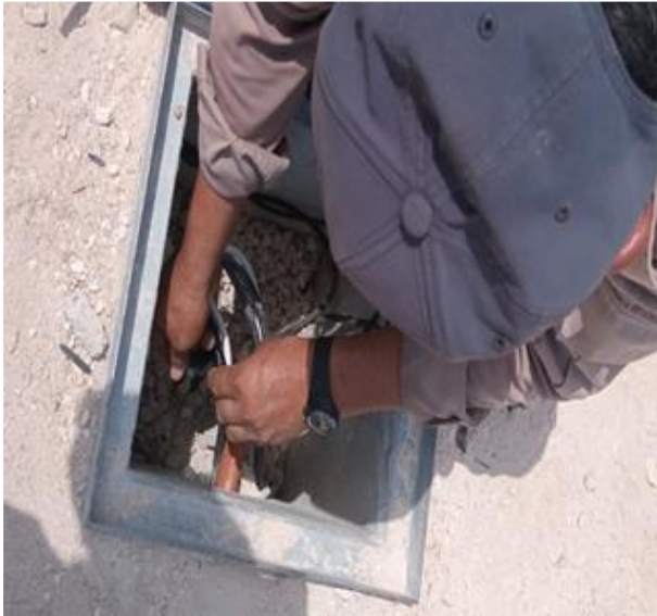
REHABILITACIÓN DE LÍNEAS DE ALUMBRADO PÚBLICO; COL. CENTRO, EN LA UNIDAD DEPORTIVA.