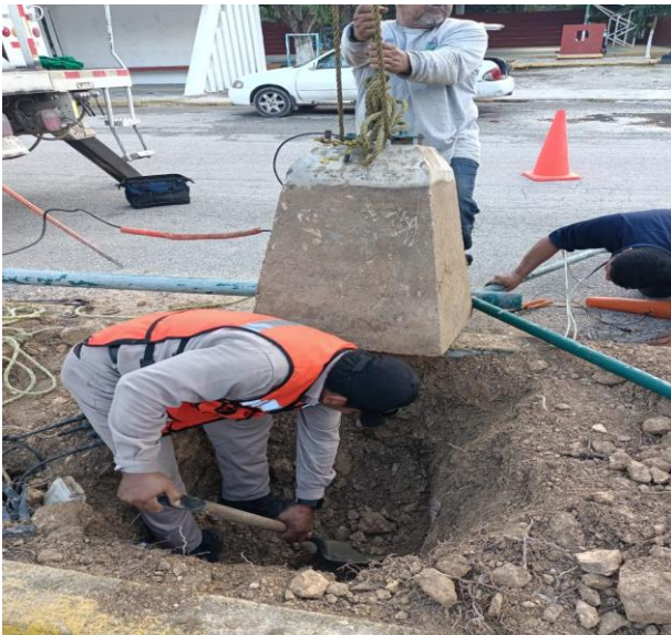
CAMBIO DE POSTE DAÑADO POR NUEVO; POBLADO DE MANUEL ANTONIO AY.