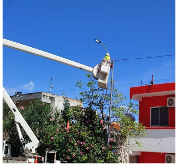
CAMBIO DE 2 LUMINARIAS OBSOLETAS POR NUEVOS TIPO LED; POBALDO DE AKUMAL.