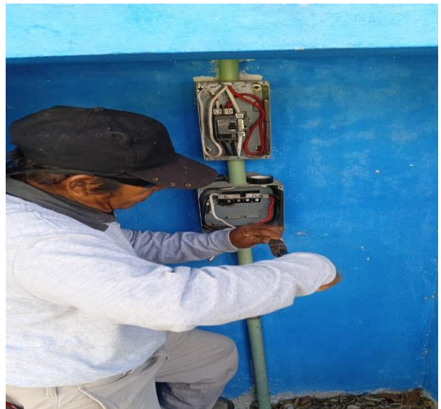
REHABILITACIÓN EN BANCO DE CONTROL; POBLADO DE MACARIO GOMEZ, EN EL PARQUE.