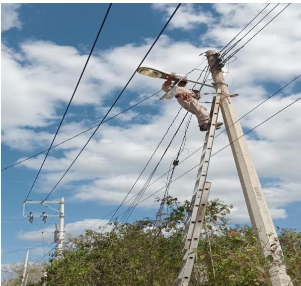
REHABILITACIÓN DE LUMINARIA; POBLADO DE MANUEL ANTONIO AY.