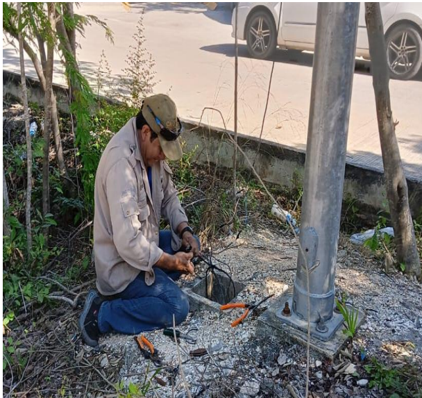
REHABILITACIÓN DE LÍNEAS DE ALUMBRADO PÚBLICO; FRACCIONAMIENTO ALDEA ZAMA.