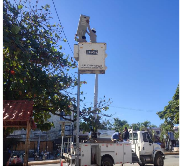
CAMBIO DE 3 LUMINARIAS OBSOLETAS POR NUEVOS TIPO LED; COL. CENTRO, AV. TULUM.