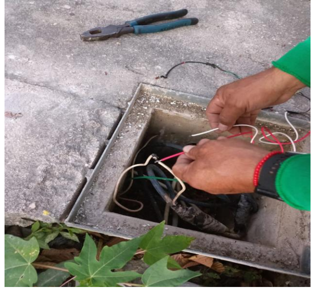
REHABILITACIÓN DE LÍNEAS DE ALUMBRADO PÚBLICO; COL. TUMBEN KAA, CALLE RIO CARDENAS Y CALLE RIO DE LA CONCORDIA.