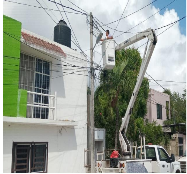
REHABILITACIÓN DE FOTOCELDA; COL. EJIDO NTE, CALLE CHANCHEN EN VARIOS PUNTOS.