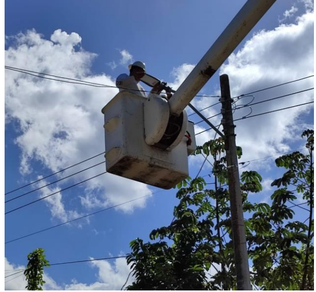
REHABILITACIÓN DE 8 FOTOCELIDAS; POBLADO DE SAN JUAN.