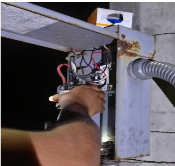
REHABILITACIÓN EN BANCO DE CONTROL; COL. TUMBEN KAA, CALLE 24 ENTRE CALLE YOTDZONOT Y AV. 1.