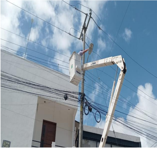
REHABILITACIÓN DE FOTOCELDA; COL. EJIDO NTE, CALLE CHANCHEN EN VARIOS PUNTOS.