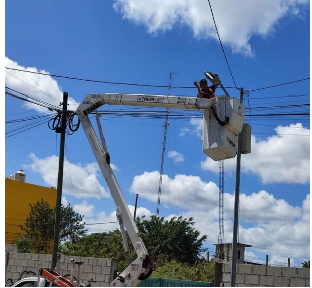
CAMBIO DE LUMINARIA OBSOLETA POR NUEVO TIPO LED; COL. CENTRO, CALLE ALFA Y VENUS OTE.