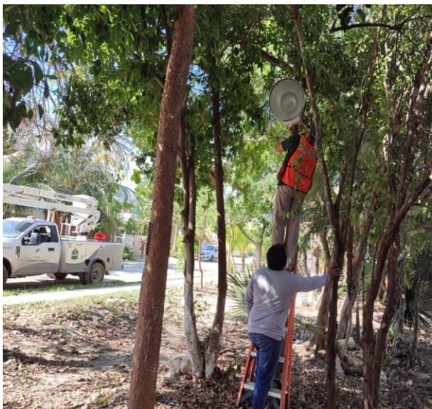
REHABILITACIÓN DE REFLECTOR; FRACCIONAMIENTO GUERRA DE CASTAS, EN EL PARQUE.