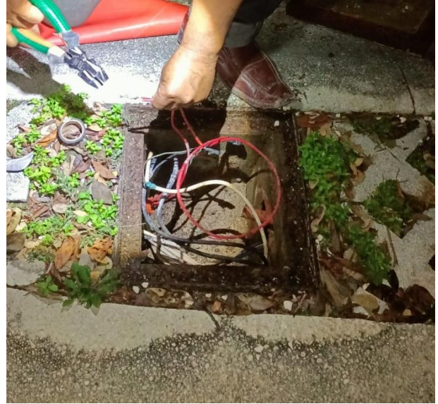
REHABILITACIÓN DE LÍNEAS DE ALUMBRADO PÚBLICO; FRACCIONAMIENTO ALDEA ZAMA.