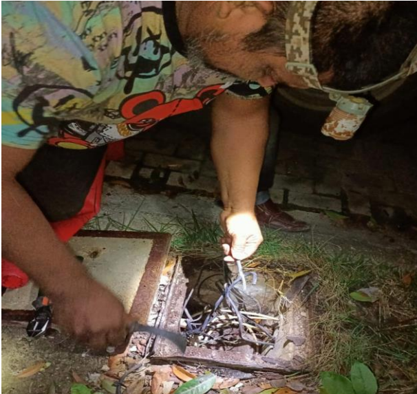
REHABILITACIÓN DE LÍNEAS DE ALUMBRADO PÚBLICO; FRACCIONAMIENTO ALDEA ZAMA.