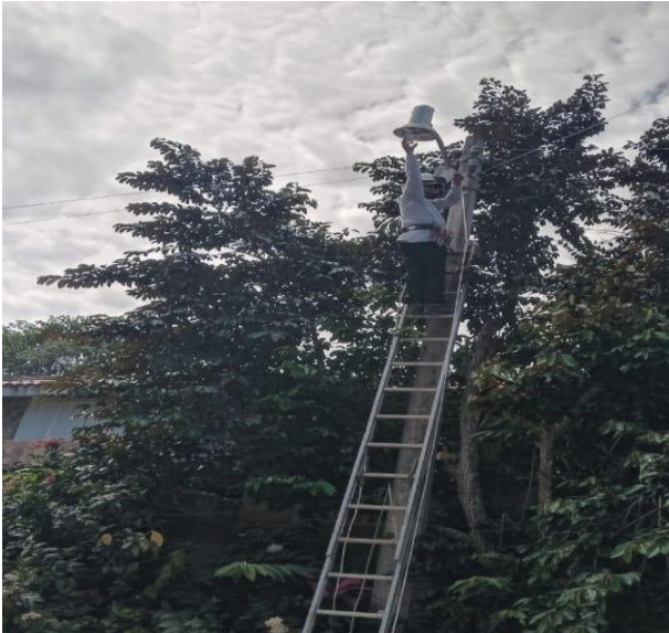
REHABILITACIÓN DE LUMINARIA; POBLADO DE MANUEL ANTONIO AY.