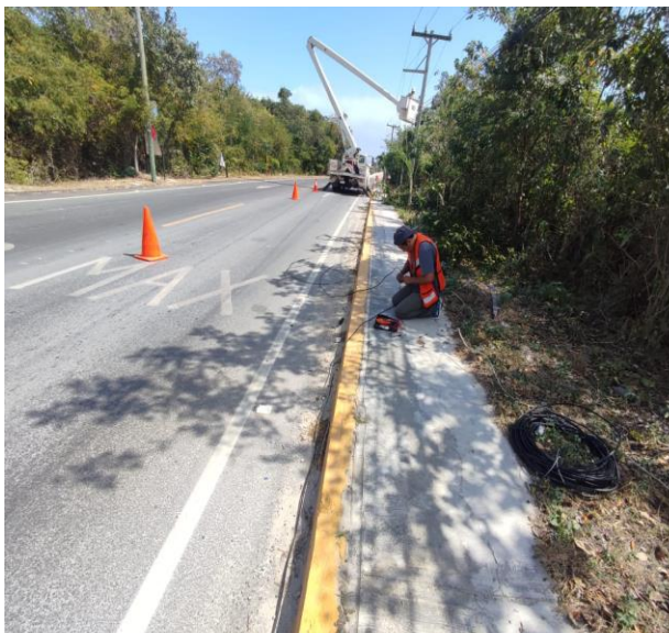
REHABILITACIÓN DE LÍNEAS DE ALUMBRADO PÚBLICO; POBLADO DE CHEMUYIL, CALLE RAMAL A CHEMUYIL.