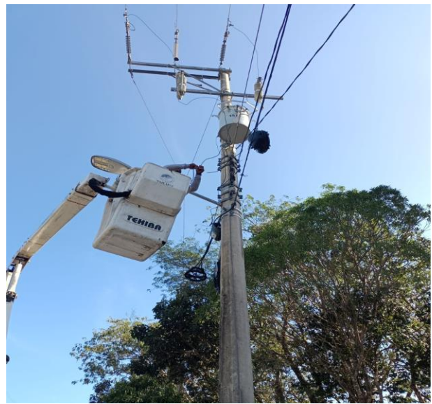
REHABILITACIÓN DE LUMINARIA; COL. LA VELETA, CALLE PUNTA ALLEN ENTRE CALLE ZAC-BE Y AV. BOCA PAILA.