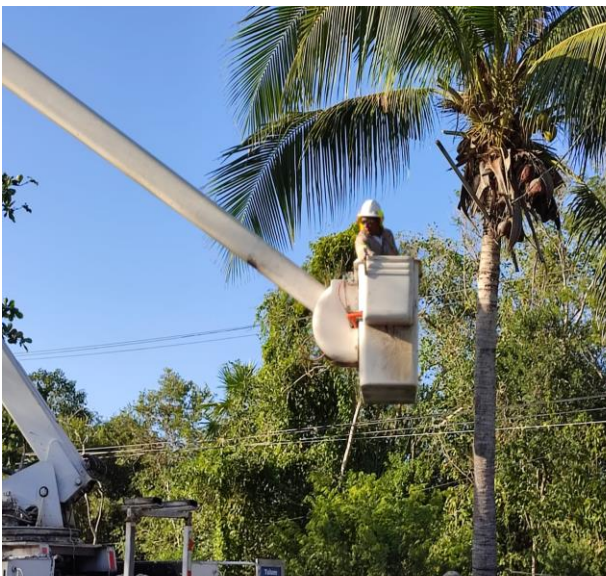
CAMBIO DE LUMINARIA OBSOLETA POR NUEVO TIPO LED; POBLADO DE AKUMAL, DEL LADO DEL ANDADOR A LA PLAYA.