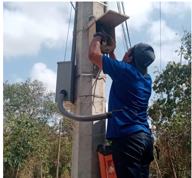
REHABILITACIÓN EN BANCO DE CONTROL; COL. EJIDO, CALLE CHAN-CHEN.