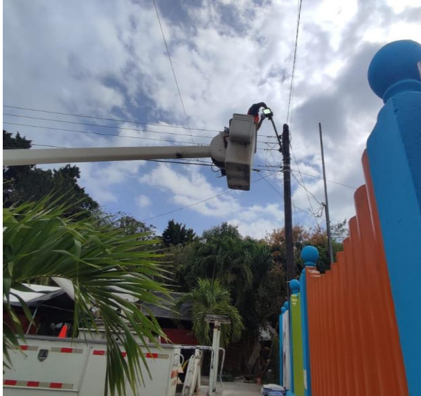
REHABILITACIÓN DE FOTOCELDA; POBLADO DE CHEMUYIL.