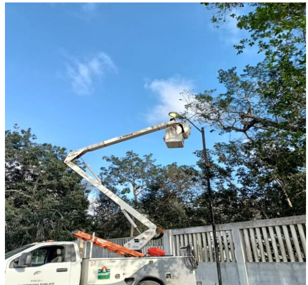
REHABILITACIÓN DE 2 LUMINARIAS; CARRETERA FEDERAL EN LA CASA EJIDAL.