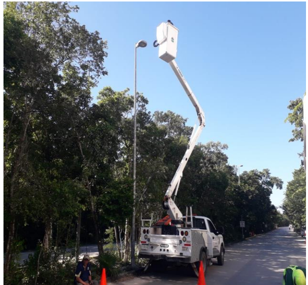
REHABILITACIÓN DE 24 LUMINARIAS; FRACCIONAMIENTO ALDEA ZAMA.