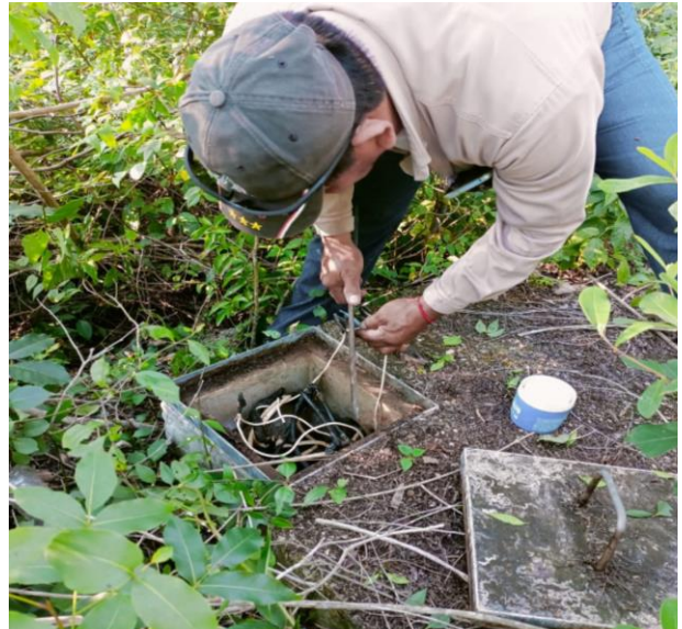
REHABILITACIÓN DE LÍNEAS DE ALUMBRADO PÚBLICO; COL. TUMBEN KAA, CALLE ZANAPAN ENTRE CALLE RIO ROSARIO Y RIO JOAQUIN.