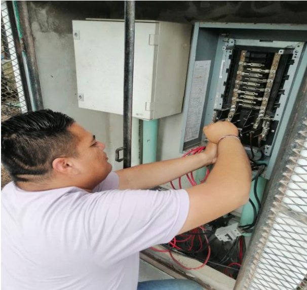
REHABILITACIÓN EN BANCO DE CONTROL; COL. MAYAPAX, CALLE JUPITER ENTRE CALLE TUN-K'UL Y 4 OTE.