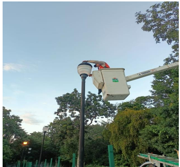
REHABILITACIÓN DE LUMINARIA; COL. CENTRO, CALLE 2 PTE ENTRE CALLE ACUARIO NTE Y 4 PTE.