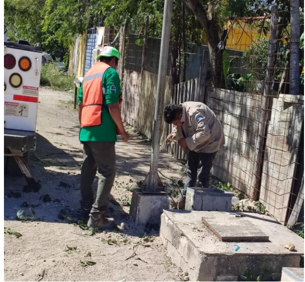
CAMBIO DE POSTE DAÑADO POR NUEVO; COL. TUMBEN-KA, CALLE 17.