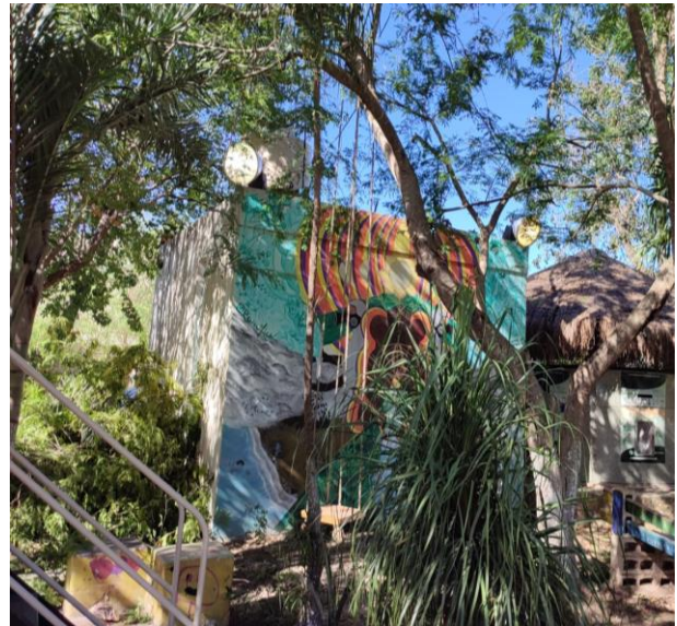
REHABILITACIÓN DE 4 REFLECTORES; FRACCIONAMIENTO GUERRA DE CASTAS, EN EL PARQUE.