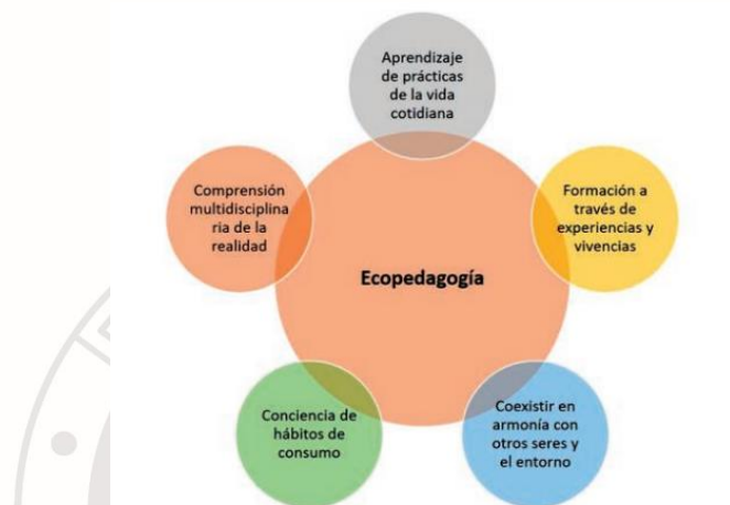
Fig. 5. Componentes de la Ecopedagogía

La eco pedagogía sostiene una visión planetaria que plantea una nueva concepción de la educación para que todo ser humano sea capaz de enfrentarse a los nuevos desafíos globales, reconociendo a la Tierra como un único hogar, promoviendo un sentimiento de identidad planetaria. Es una pedagogía que promueve una ciudadanía comprometida con la cultura de la sostenibilidad, los derechos humanos, la paz, la justicia y el compromiso activo, e implica un cambio en las estructuras económicas, sociales, culturales y del desarrollo humano 2 .