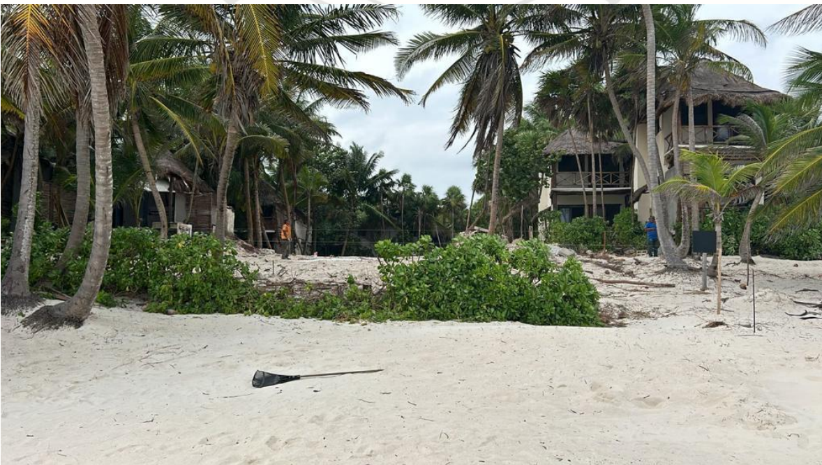
2 SE REPORTA MOVIMIENTO DE ARENA EN ZONA FEDERAL