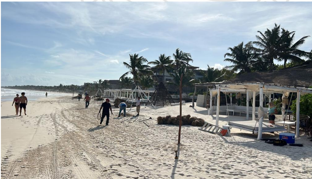
5 SE REPORTA MOVIMIENTO EN ZONA FEDERAL DE OBRA CIVIL