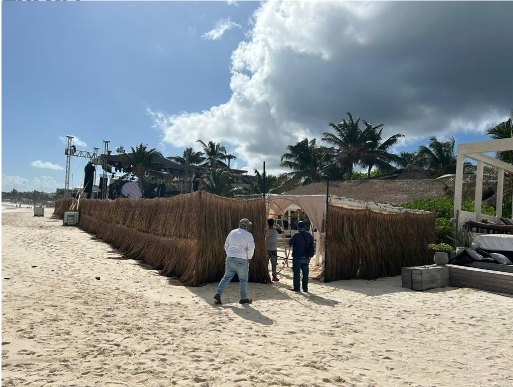
4 SE ATIENDE REPORTE DE MONTAJE EN ZONA FEDERAL