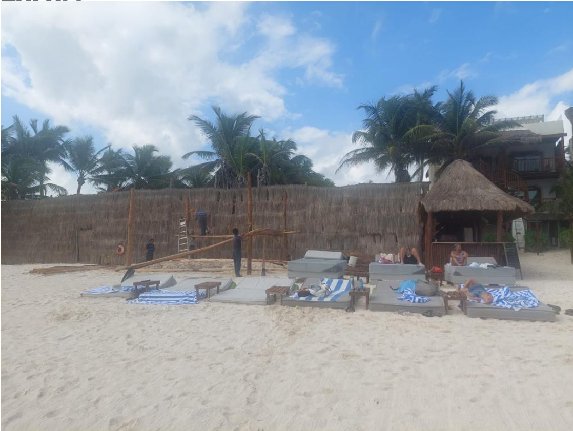
1 SE REPORTA MONTAJE EN ZONA FEDERAL