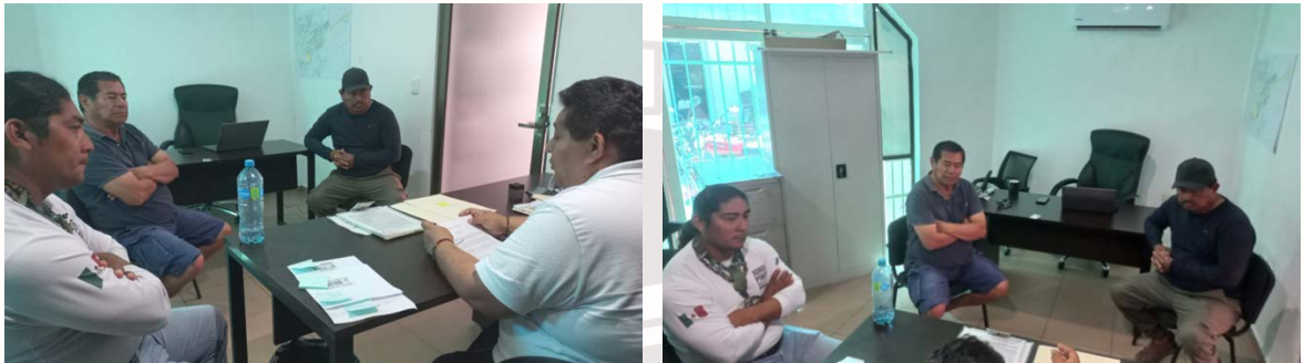
Imagen 4.- Se atendió a comerciantes y prestadores de servicio en la zona arqueológica en las oficinas de comercio

VIERNES 20 DE ENERO 2023: Se tiene reunión para el acuerdo y deslinde de áreas de trabajo en zona arqueológica con comerciantes de exposición fotográfica con animales.