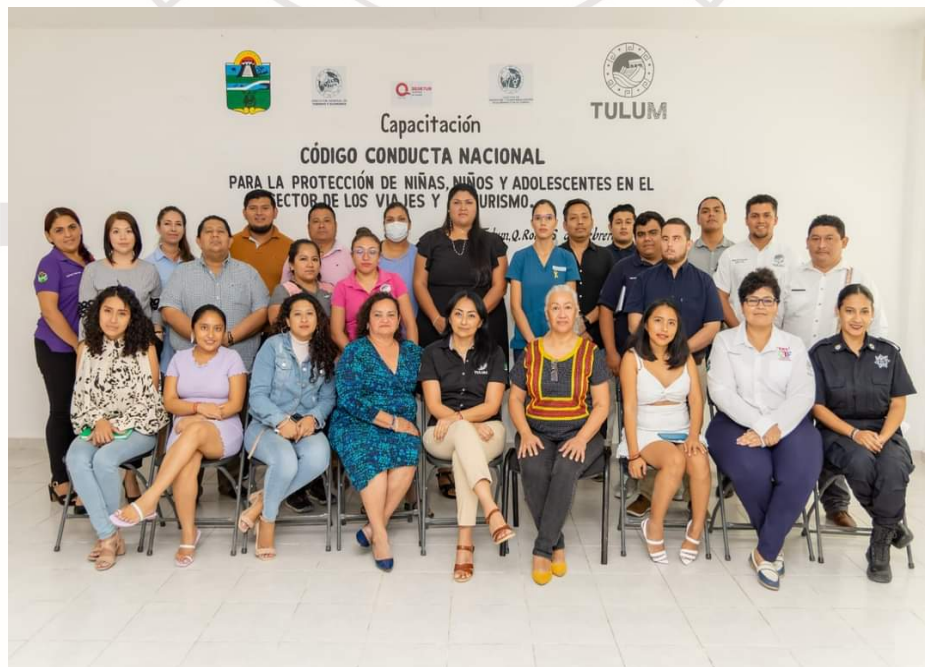
Imagen 17.- Se asiste al curso de código de conducta al medio día

JUEVES 16 DE FEBRERO DE 2023: Se acude al curso de código de conducta organizado por parte de la dirección de transversalización y perspectiva de género.