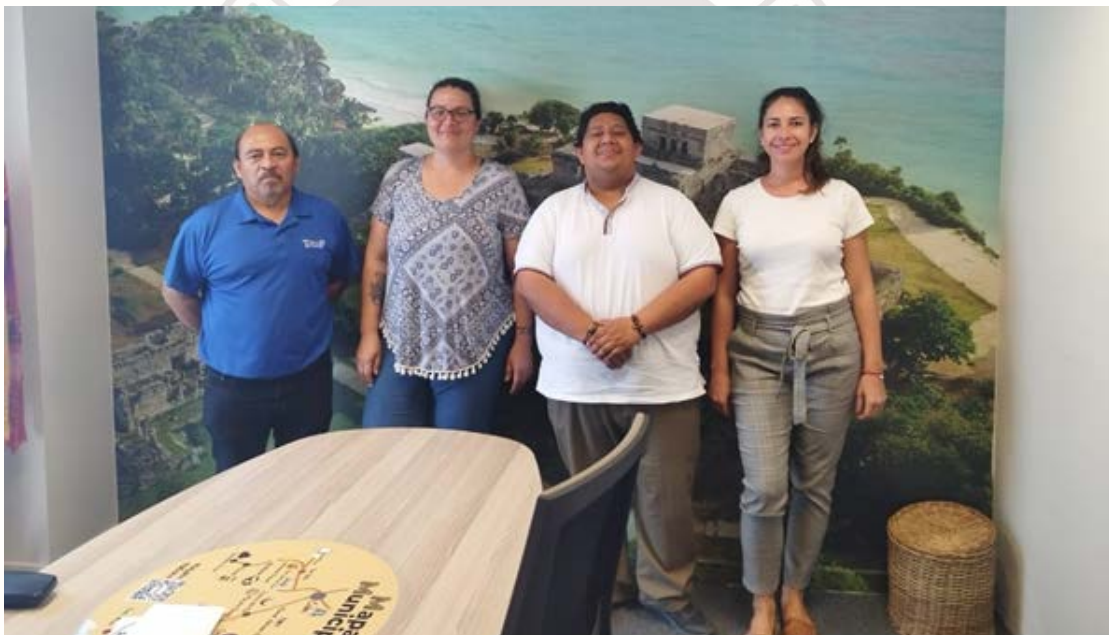
Imagen 26.- Reunion con la empresa INTREPIC.

MARTES 7 DE MARZO DE 2023: Se reúnen por primera vez la dirección general de turismo y economía, la dirección de economía y la empresa Intrepic para tratar temas acerca del recorrido en la zona maya, la reunión en la que estuvo presente un representante de la empresa INTREPIC, el Director de economía y la Dirección General.