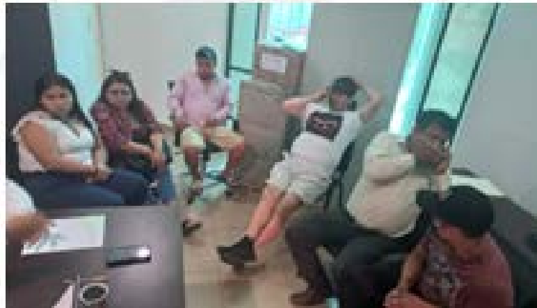
Imagen 2.- Reunión con 8 comerciantes ambulantes De la AV. Tulum y otros de la calle Satélite.

JUEVES 12 Y VIERNES 13 DE ENERO DE 2023: El Director de economía atiende a comerciantes ambulantes y semifijos que ejercen el comercio en la vía pública, se les hace mención de la importancia de acatar los horarios, el uso de uniformes, mantener vigente el pago de sus permisos, la limpieza del área de trabajo, así como actualizar sus dictámenes de protección civil y salud.