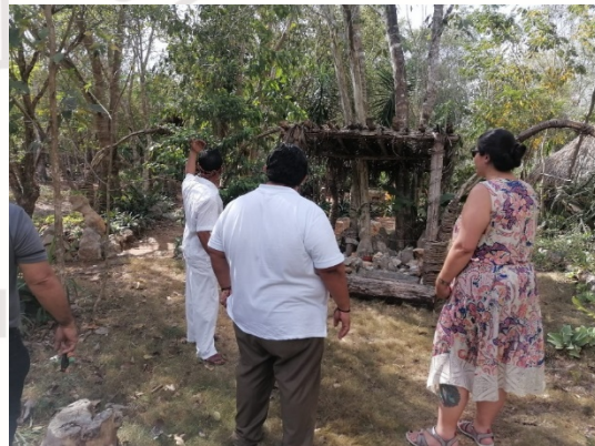
Imagen 27.- Recorrido en la zona maya con la empresa INTREPIC.