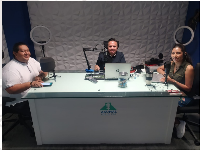
Imagen 33.- Entrevista con la emisora de radio

SABADO 18 DE MARZO. – En conmemoración del DÍA DEL ARTESANO Y DE LA ARTESANA se realiza un evento en la explanada del parque museo de la cultura maya en donde artesanos mayas, comerciantes, emprendedores y expositores y artistas lograron poder exhibir sus, piezas y demás.