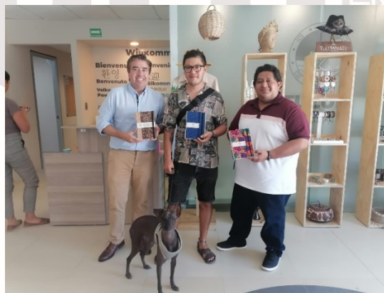
Imagen 36. – Se habla de una posible colaboración de la marca Kalipso con las Artesanas de la zona maya.

MIÉRCOLES 22 DE MARZO. – Se recibe al empresario de la marca Kalipso, en donde nos presenta su línea de cuadernillos reciclados hechos en Tulum. Recibiéndolo el Director de Economía y el Director general de Turismo y Economía.