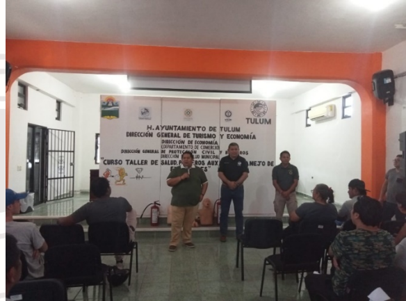
Imagen 18.- Se finaliza curso de primeros auxilios

SABADO 18 DE FEBRERO DE 2023: Taller de bordado para el empoderamiento economico de las mujeres.