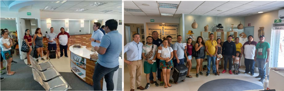
Imagen. 37 – Se realiza la reunión en las oficinas del CITAEM en un horario de las 10:00 am

MIÉRCOLES 22 DE MARZO. – Se realiza reunión con los comerciantes en vía pública del fraccionamiento ALDEA TULUM, a cargo del Director de Economía y el Titular del Departamento de Comercio. Se les invito a los comerciantes a seguir trabajando de la mano con la autoridad en turno.