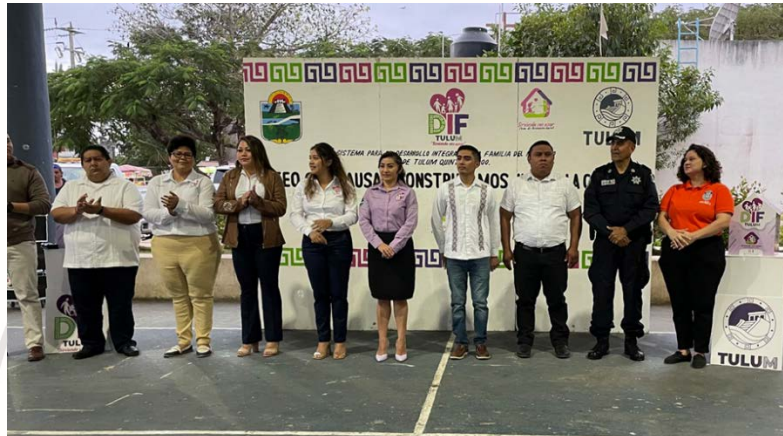
Imagen 12.- Evento de boteo del DIF TULUM.

DOMINGO 12 DE FEBRERO 2023: Se asistió al arranque de boteo CAS del DIF TULUM.