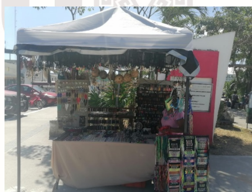
Imagen 24.- Se ordenan los espacios asignados a los comerciantes en explanaaa de parque dos aguas.