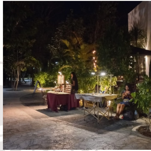
Imagen 20.- Se beneficia 8 artesanos

MIÉRCOLES 22 DE FEBRERO DE 2023: Se realiza una reunión con los comerciantes de aldea tulum, piden que se les haga una visita a sus puestos en la noche.