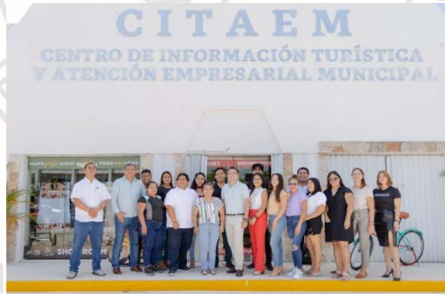
Imagen 40. – Conmemoración del día del taco.

Sin más por el momento agradezco la atención prestada y me despido deseándole un excelente día.