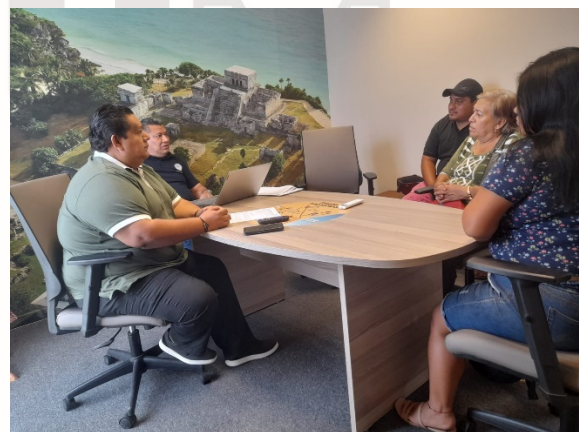
Imagen 31.- Reunión con comerciantes.