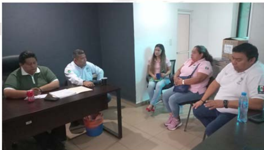
Imagen 7.- Reunión con Dirección de Servicios públicos y tránsito

JUEVES 26 DE ENERO 2023: Reunión en las oficinas de comercio con tránsito y servicios públicos, el Director de Economía en conjunto con el Titular del Departamento de Comercio para tratar el tema de residuos sólidos en la vía pública.