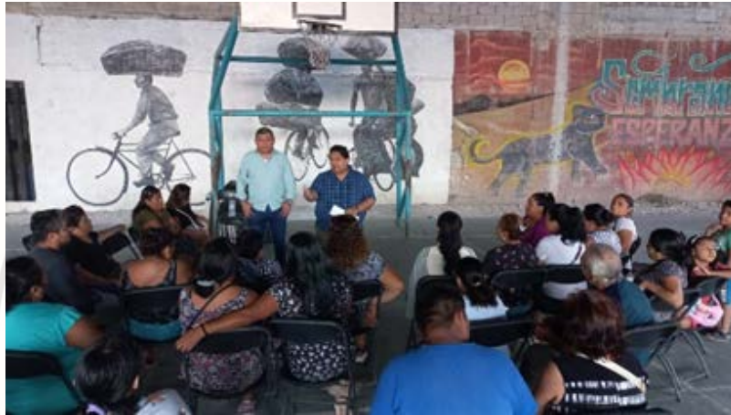
Imagen 8.- Reunión con tianguistas.

MIÉRCOLES 8 DE FEBRERO 2023: Reunión con tianguistas en el domo parque CROC a las 5:30 pm.