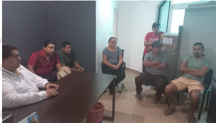
Imagen 10.- Reunión con comerciantes.

JUEVES 09 DE FEBRERO 2023: Reunión con los comerciantes de la calle satélite norte entre calle polar y calle 2 oriente, se reunieron 7 comerciantes con el Director de Economía y el titular del Departamento de Comercio, se realiza acuerdo con los comerciantes en vía pública, se les indica cumplir con el reglamento vigente.