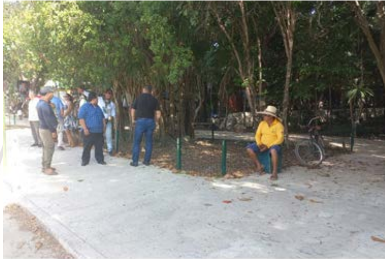
Imagen 6.- Visita de seguimiento de trabajos en la Zona arqueológica.

MARTES 24 DE ENERO DE 2023: Se asiste a la zona arqueológica para el seguimiento y visita en el lugar donde existe conflicto entre prestadores de servicio.