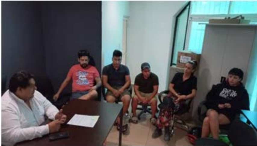
Imagen 14.- Reunión con comerciantes.

MIÉRCOLES 15 DE FEBRERO DE 2023: A través de la gestión de la dirección de economía se logra un espacio para la exhibición y venta de productos para artesanos y productores en el área comercial de ALDEA ZAMA.