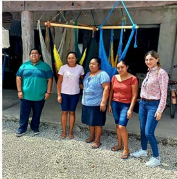
Imagen 32.- Algunas de las comunidades mayas que se visitaron fueron Macario Gómez, Manuel Antonio y Francisco Uh May