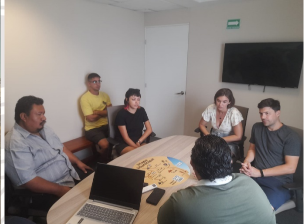
Imagen 30.- Reunión con comerciantes.

MARTES 14 DE MARZO. – Se realiza reunión con los comerciantes de la vía pública de la calle satélite sur entre av. Tulum y calle mercurio a cargo del Director de Economía y el Titular del Departamento de Comercio. Se menciona a los comerciantes el reglamento vigente y seguir trabajando de la mano y de manera coordinada con la autoridad en turno.