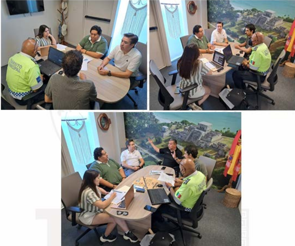
Imagen 39. – Reunion en las oficinas del CITAEM .

MIÉRCOLES 29 DE MARZO. – Se participa en una reunión con tránsito para tratar el proyecto de ordenamiento de comercios semifijos av. Coba con beta norte, dirección de Planeación, Transito, Departamento de Comercio y la dirección de Economía.