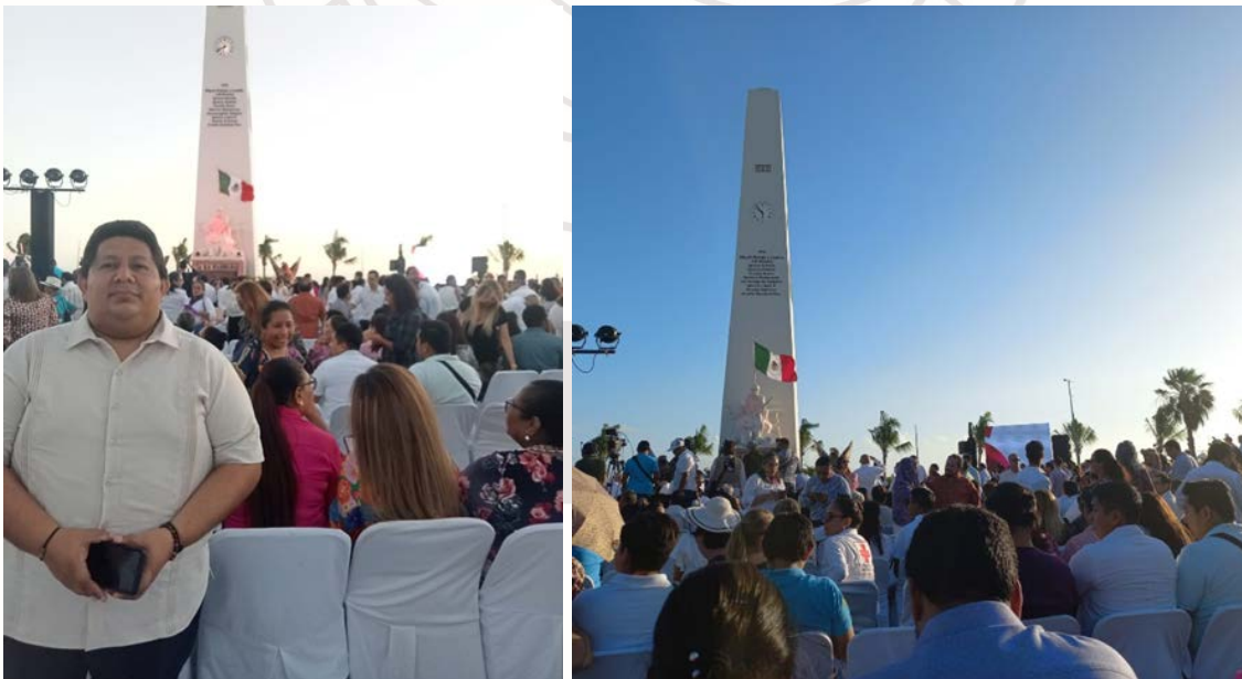
Imagen 5.- Asistencia a la presentación del plan estatal dio sede en el hasta de bandera Chetumal.

LUNES 23 DE ENERO DE 2023: Se comisiona al Director de Economía para asistir a la presentación del plan estatal de desarrollo 2023-2027.