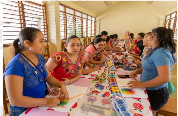
Imagen 19.- Se inicia curso de bordado a cargo de la dirección de transversalización y perspectiva de genero

MIERCOLES 22 DE FEBRERO DE 2023: 2da. Edición de artesanos y productores en el interior del corredor del área comercial de aldea zama miércoles 22 de febrero.