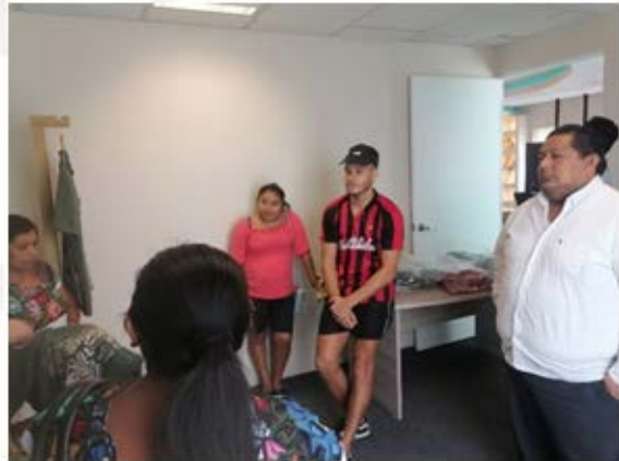
Imagen 29.- Entrega de productos de artesanas a empresa Tulum Essencial.