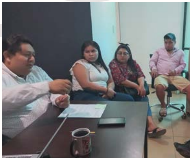
Imagen 9.- Reunión con comerciantes.

JUEVES 09 DE FEBRERO 2023: Reunión con los comerciantes de la calle satélite norte entre Av. Tulum y calle polar, se reunieron 7 comerciantes con el Director de Economía y el titular del Departamento de Comercio, se realiza acuerdo con los comerciantes en vía pública y se menciona los puntos a cumplir.