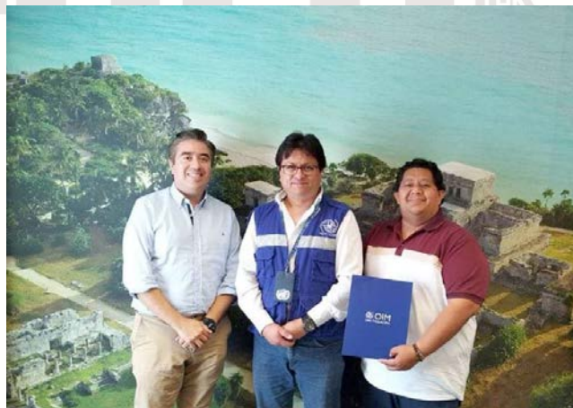
Imagen 38. – El encuentro se llevo acabo en las oficinas del CITAEM

MIÉRCOLES 22 DE MARZO. – El director de la Dirección de Economía y el director General de Turismo y Economía se reunió con el representante de la OIM MÉXICO perteneciente a la ONU MÉXICO en calidad de organización asociada, y colaborar en el estudio para identificar y analizar la aplicabilidad y efectividad de la tarjeta Visitante Trabajador Fronterizo como instrumento de regularización laboral migratoria para personas guatemaltecas y beliceñas en el sureste de México.