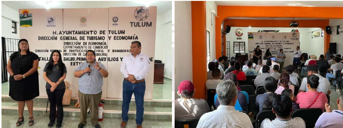
Imagen 16.- Se inicia los cursos en horario de 10:00 a.m. a 12:00 del día

JUEVES 16 DE FEBRERO DE 2023: Curso “taller de salud, primeros auxilios y manejo de extintores”. En el auditorio de la UNTRAC.