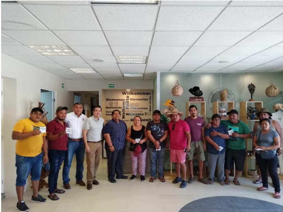
Imagen 28.- Reunion con comerciantes.

VIERNES 10 DE MARZO.- Artesanas de la zona maya realizan entrega de productos a la empresa TULUM ESSENCIAL siendo un enlace la Dirección de Economía, teniendo lugar en las oficinas del CITAEM.