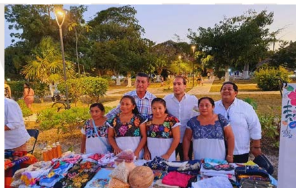
Imagen 25.- Festival cultural XVI ANIVERSARIO DE BACALAR