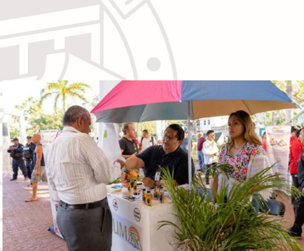
Imagen 23.- Se 2do "FESTIVAL GASTRONOMICO DEL CARIBE"

DOMINGO 26 DE FEBRERO DE 2023: Se realiza asignación de lugar a los artesanos en la explanada del parque dos aguas.