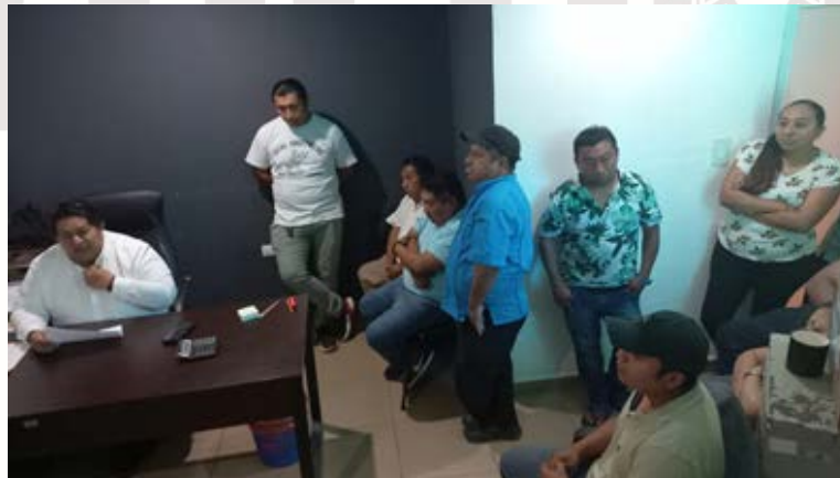
Imagen 11.- Reunión con comerciantes.

VIERNES 10 DE FEBRERO 2023: Reunión con los comerciantes de la calle satélite sur entre av. Tulum y calle mercurio se reunieron 7 comerciantes con El Director de Economía y el titular del Departamento de Comercio, se realiza acuerdo con los comerciantes de la vía pública, se les menciona puntos a seguir con base al reglamento vigente. La reunión se realiza a las 12:00 m en las oficinas del Departamento de Comercio.