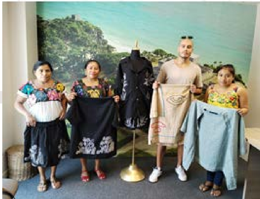
Imagen 1.- Se realiza entrega de las prendas bordadas por las artesanas de Yaxche.