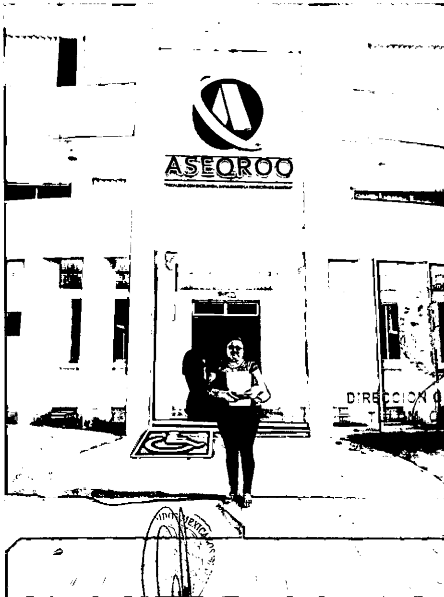
Foto de comprobación, en que asistió el día 28 de septiembre del presente año, en el cual asistió y participo en una reunión con personal de la auditoria superior del estado para asesoría en materia de adquisición de bienes y servicios que se llevó a cabo en las oficinas generales de la auditoria superior del estado, ubicado en av. Álvaro obregón no. 353 en la colonia centro de la ciudad de Chetumal Quintana Roo.