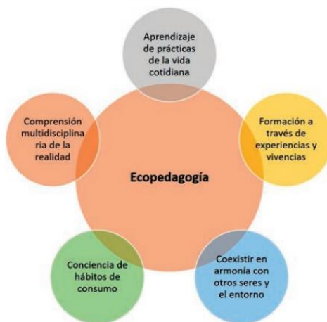
Fig. 5. Componentes de la Ecopedagogía

La eco pedagogía sostiene una visión planetaria que plantea una nueva concepción de la educación para que todo ser humano sea capaz de enfrentarse a los nuevos desafíos globales, reconociendo a la Tierra como un único hogar, promoviendo un sentimiento de identidad planetaria. Es una pedagogía que promueve una ciudadanía comprometida con la cultura de la sostenibilidad, los derechos humanos, la paz, la justicia y el compromiso activo, e implica un cambio en las estructuras económicas, sociales, culturales y del desarrollo humano 2 .