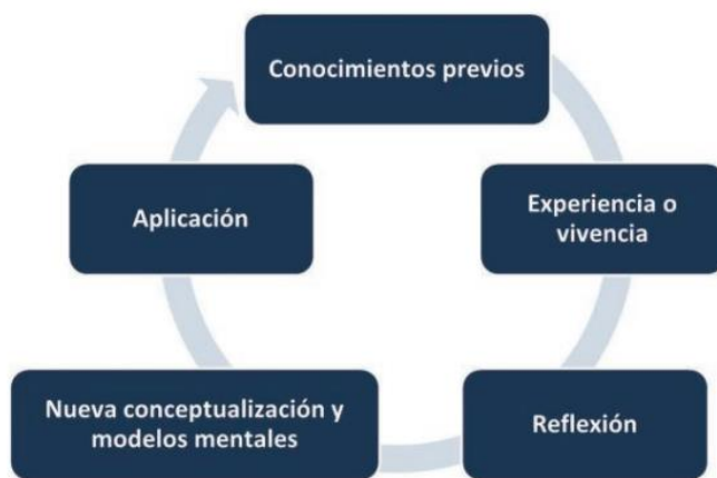
Fig. 2. Aprendizaje significativo. Adaptado de Ausubel (1983).

De acuerdo con el psicólogo y pedagogo David Ausubel, el conocimiento verdadero sólo puede nacer cuando los nuevos contenidos tienen significado al ser asociados con conocimientos previos. Es decir; aprender significa que los nuevos conceptos se conectan con los anteriores; no porque sean iguales, sino porque tienen relación entre sí de acuerdo a experiencias personales previas. En el aprendizaje significativo, la estructura de los conocimientos previos condiciona los nuevos conocimientos y experiencias, y estos a su vez modifican y reestructuran los anteriores. Esta metodología es uno de los pilares centrales de la psicología constructivista que hoy se promueve en los nuevos modelos educativos.